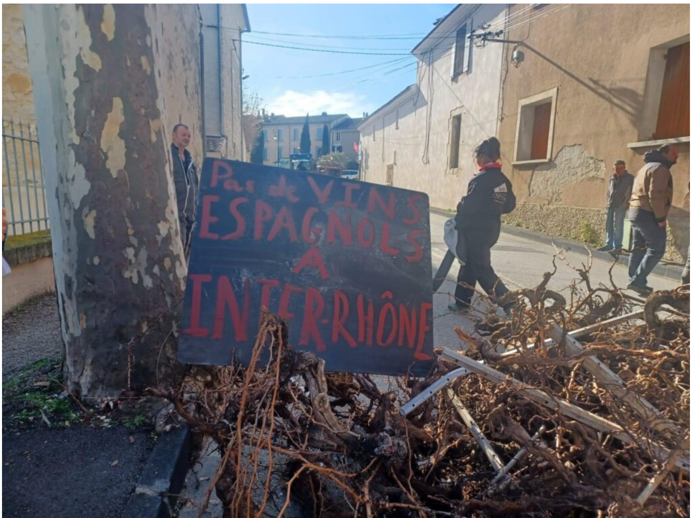
Manifestation à Sablet.

Le 25 novembre dernier, ce sont les viticulteurs qui ont défilé à Narbonne pour afficher leurs doléances face à la concurrence déloyale d'importation de vins produits par nos voisins européens qui, eux, n'ont pas à se plier à des injonctions de normes aussi drastiques que les nôtres. Au début de l'année, on a vu les Jeunes Agriculteurs retourner les panneaux de signalisation à l'entrée des villes et villages pour montrer qu'on marchait sur la tête. Mais personne, dans les hautes sphères, n'a fait attention à ces signaux d'alarme.