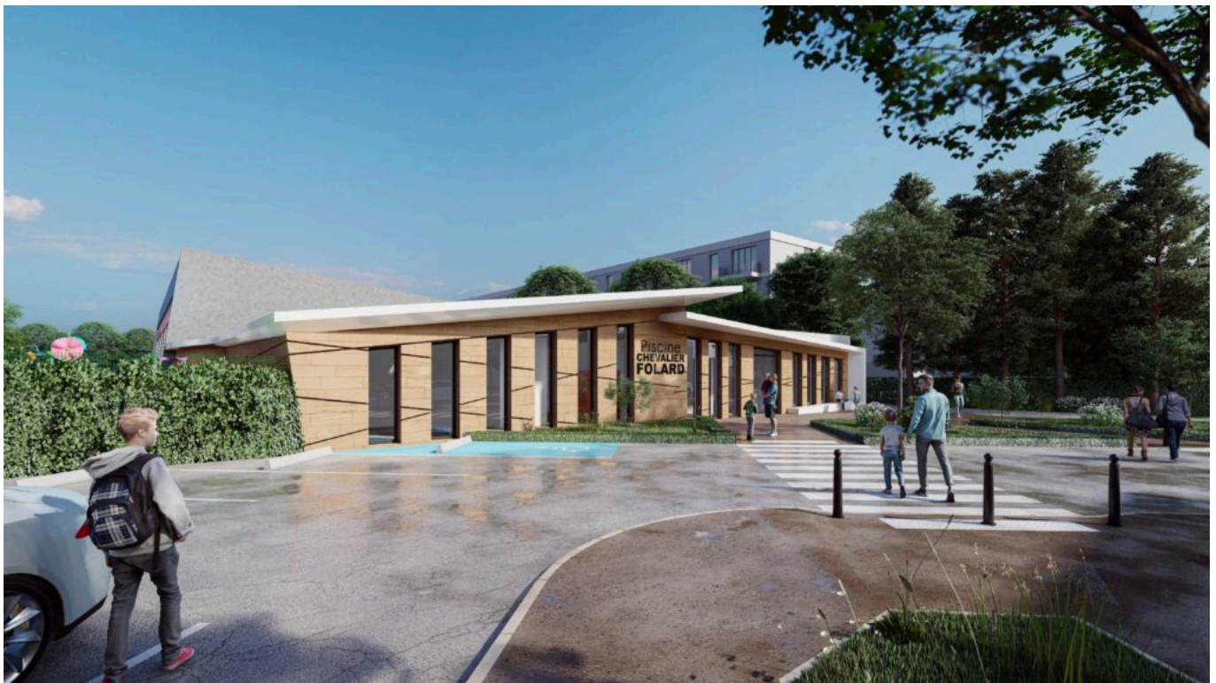
Futur extérieur de la piscine Chevalier de Folard