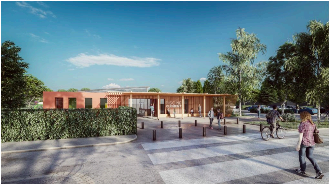
Futur extérieur de la piscine Jean Clément

«La plupart du temps vous voyez ces piscines, comme ça a été le cas pour le stade nautique, fermées, oubliées, laissées à l'abandon alors qu'elles sont des enjeux du territoire, reprend le maire. Et puis avec les températures auxquelles nous sommes confrontés en saison estivale, qui ne rêve pas de fréquenter ces lieux où l'on peut se rafraîchir et se reposer en famille, grands-parents, parents, enfants, petits-enfants, ensemble, parfois même en profitant d'un extérieur. C'est ce à quoi j'ai assisté, cet été, en me rendant au stade nautique où l'ambiance était paisible.» Justement c'est le point noir des piscines où les ados turbulents sont montrés du doigt, évinçant la tranquillité des familles et des plus petits ? « Pas quand on a met en place des animations et cela a fait tout la différence,» souligne le premier magistrat de la ville. En termes de chiffre de fréquentation ? Le stade nautique devrait accueillir, dans une année normale, 200 000 personnes. Les autres piscines ? Peut-être tout autant...» considère l'édile.