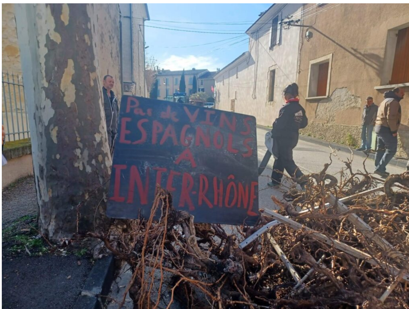
Manifestation à Sablet.

Le 25 novembre dernier, ce sont les viticulteurs qui ont défilé à Narbonne pour afficher leurs doléances face à la concurrence déloyale d'importation de vins produits par nos voisins européens qui, eux, n'ont pas à se plier à des injonctions de normes aussi drastiques que les nôtres. Au début de l'année, on a vu les Jeunes Agriculteurs retourner les panneaux de signalisation à l'entrée des villes et villages pour montrer qu'on marchait sur la tête. Mais personne, dans les hautes sphères, n'a fait attention à ces signaux d'alarme.