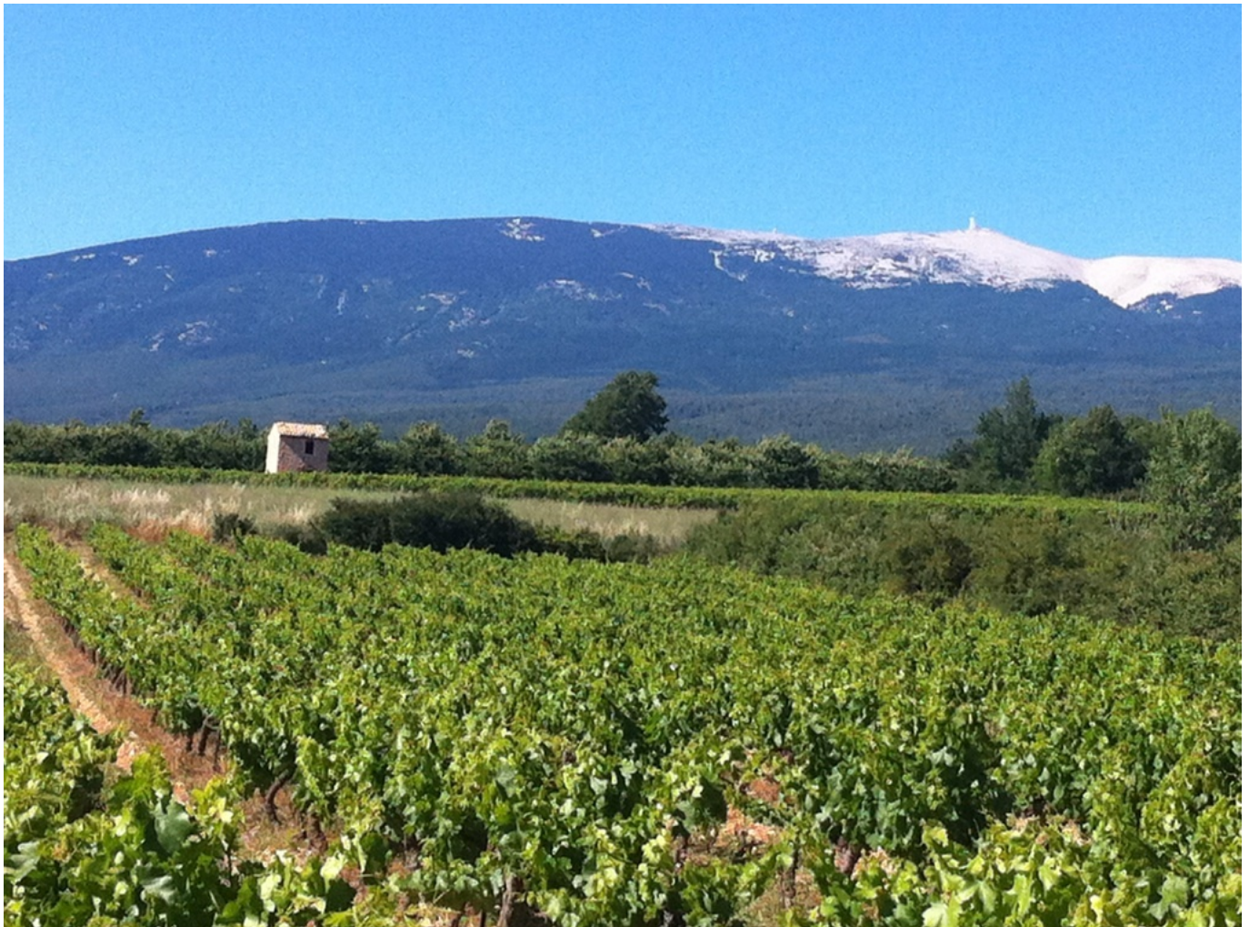
BISET V - VPA

L'AOC Ventoux et l'office de tourisme Destination Luberon Cœur de Provence s'allient pour organiser la 9 e édition du 'Fascinant week-end' pour les régions Ventoux et Luberon. Du jeudi 13 au dimanche 16 octobre, partez à la découverte des vignobles de ces régions à travers diverses animations d'exception.