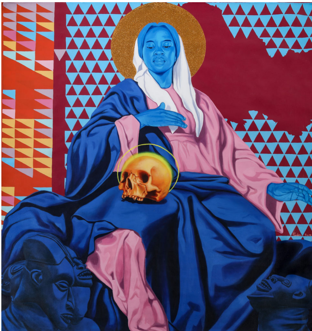
La vierge bleue de Marc Padeu Cameroun.