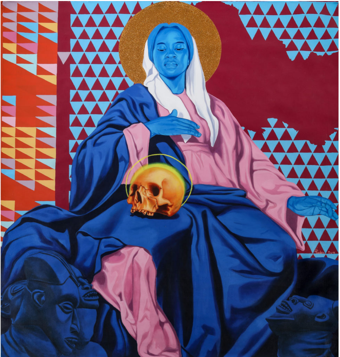
La vierge bleue de Marc Padeu Cameroun.