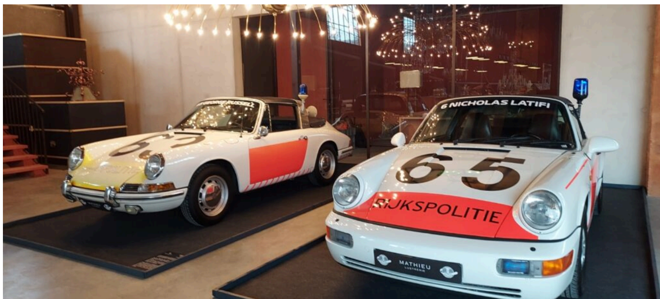
A gauche la police de Suède et à droite la police des Pays Bas

Avec cette extension, la Lustrerie Mathieu compte désormais 24 bassins de décantations d'ocres, des écluses, des malaxeurs, des fours, « Une vraie archéologie industrielle qui garde son âme, la machinerie d'avant, la mémoire de cette ancienne usine, au milieu d'un immense jardin où les gens pourront se promener, dedans et dehors, voir les lustres exposés à l'intérieur et éclairés. Je me dois de faire, dans la mesure du possible, de belles choses, qui durent, qui donnent du bonheur aux autres. »