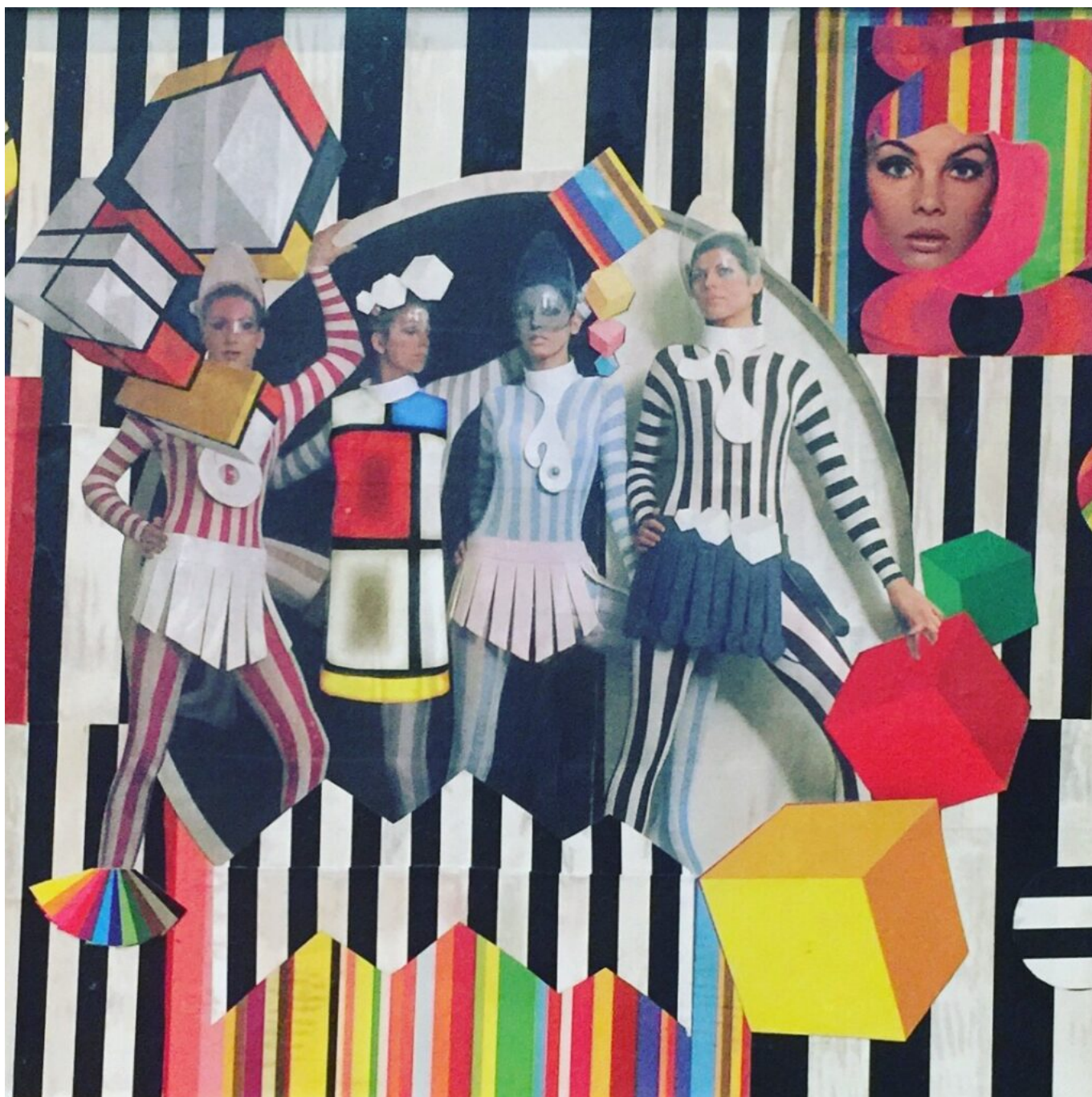
Zebra de Loli Satam