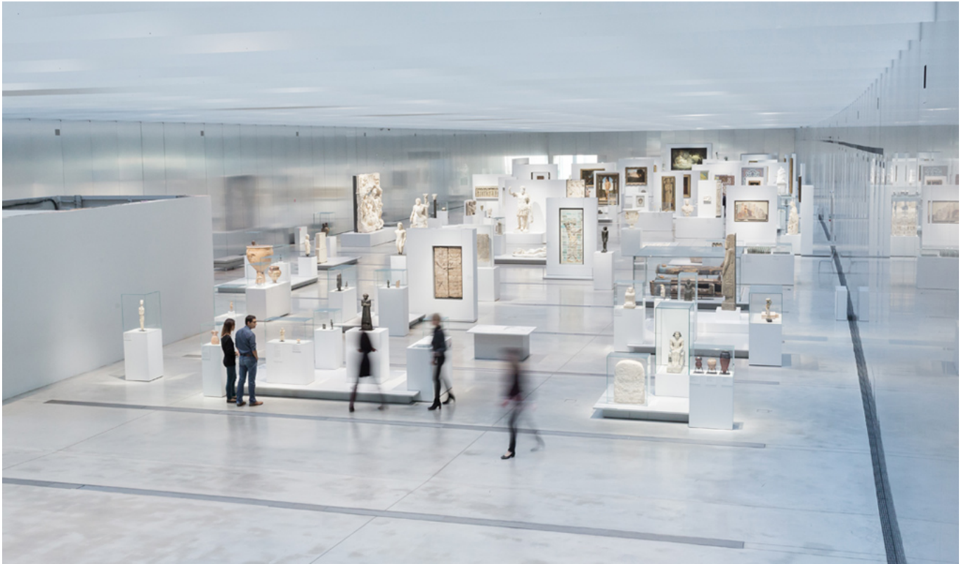
La galerie du Temps

Loin du didactisme, la frise chronologique s'est faite discrète. Il y a ainsi « autant de chemins que de visiteurs » pour traverser l'espace. On découvrira les similitudes entre un sublime sarcophage médiéval et son voisin romain, un masque guinéen de 50 kilos, ou encore un portrait de Dona Isabel de Requesens, vice-reine de Naples, par Raphaël (voir encadré).