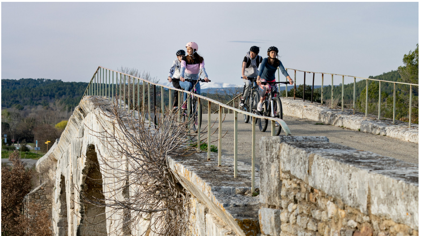
Sur le Pont Julien et la Véloroute du Calavon

Dans le Vaucluse c'est 400 km d'itinéraires balisés sur routes dédiées ou partagées, avec 3 véloroutes ( ViaRhôna , Calavon et Via Venaissia ), c'est 5 boucles et un grand tour du Luberon (240 km à lui seul). Côté tout-terrain on n'est pas en reste avec 33 itinéraires en VTT et 15 en VTC, dont la très exigeante traversée du Vaucluse en VTT (400 km et 10 000 mètres de dénivelé positif).