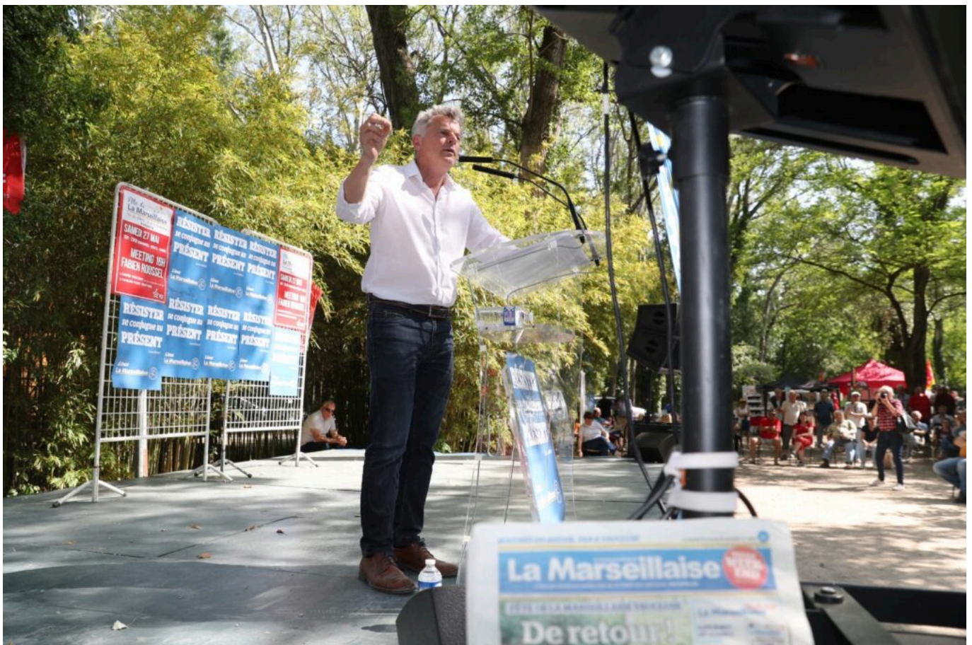
Fabien Roussel, secrétaire national du PCF, durant son intervention lors de la fête de la Marseillaise