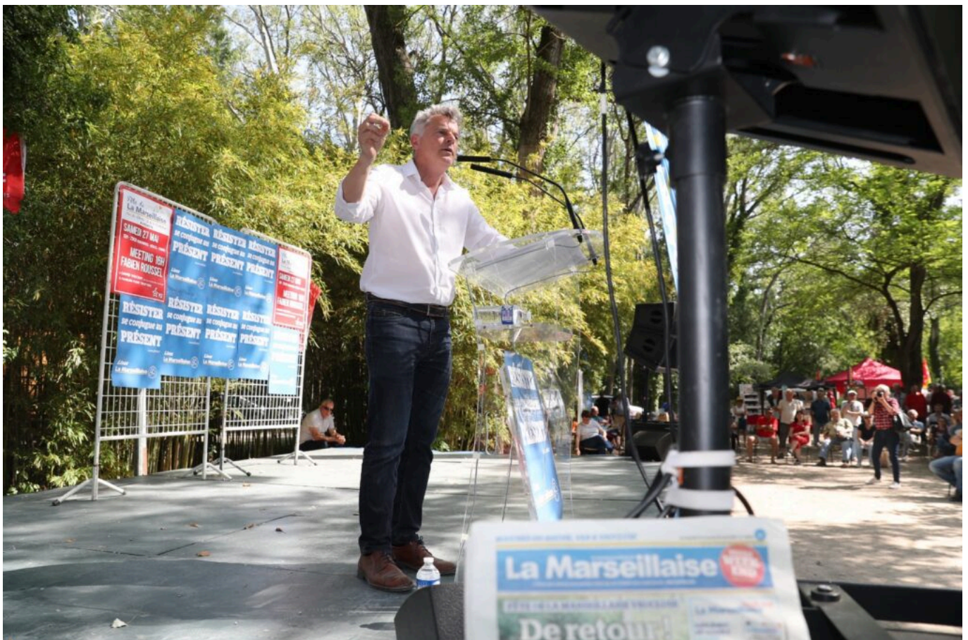
Fabien Roussel, secrétaire national du PCF, durant son intervention lors de la fête de la Marseillaise 2023 au parc des libertés.