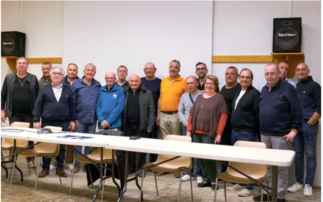
L'ensemble des membres du conseil d'administration de la Foire de Cavaillon.

corso ou la fête du melon. Les visiteurs aiment s'y retrouver chaque année et très souvent en famille. C'est une tradition.