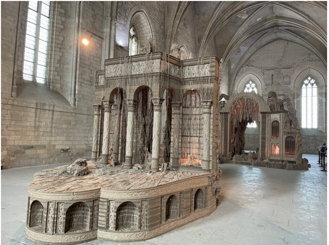
Côté Cour, Côté jardin