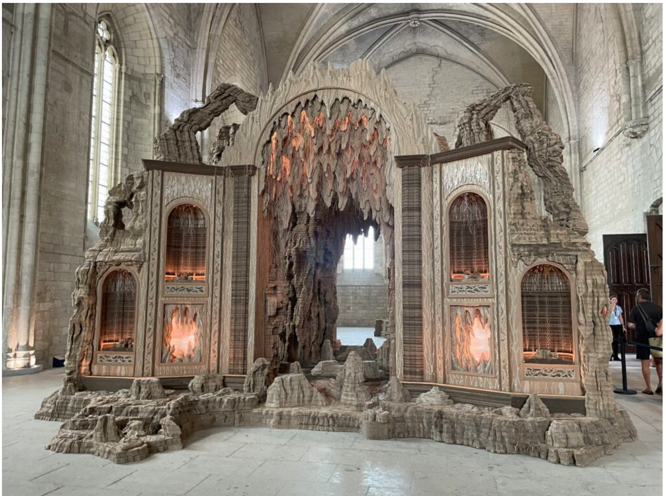
Nymphées Copyright MH

qui ont été réalisées pour un défilé Dior -Automne, Hiver 2021-22 et évoquent une promenade imaginaire au gré d'une grotte un peu baroque, puis d'une forêt, la découverte d'un petit édifice sous la forme d'une folie. « Ce que je recherche ? Que l'on se perde dans une profusion de détails dans ces œuvres monumentales. Les tapisseries ont été exécutées en Inde à Mumbai -où 100 000 brodeurs exercent leur talent- et sont les dépositaires de savoir-faire millénaires.