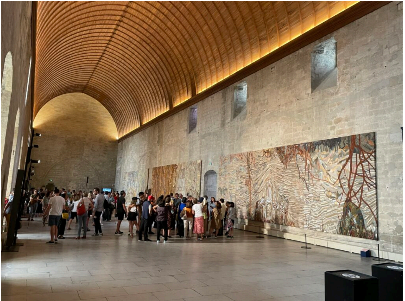
Chambre de soie , broderie de fils de soie réalisées pour le défilé Dior Automne Hiver 2021-22