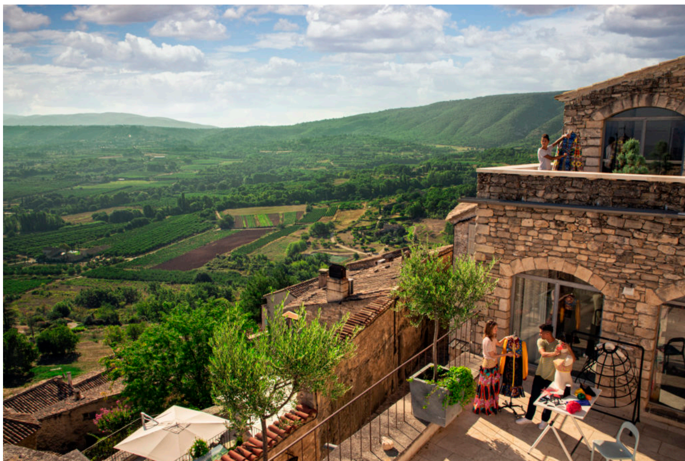
SCAD Lacoste, été 2019, discipline 'lifestyle et fashion'.

« Le village est magnifique, on a conscience qu'il est exceptionnel. On veut le valoriser encore plus et accompagner cette dynamique », appelle le directeur de ses vœux. Autre structure qui contribue au rayonnement du territoire : la galerie d'art. Les étudiants devenus artistes sont accueillis en résidence et proposent leurs œuvres. SCAD fait office d'agent et perçoit des commissions sur les ventes. Tout le campus forme une puissante galerie d'art avec sa boutique au centre : le shopSCAD . Concernant les financements, aucune subvention publique, pas même dans le cadre de la restauration des bâtiments.