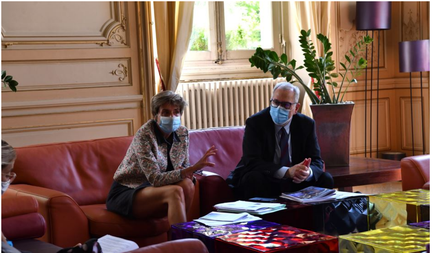
C'est l'heure du bilan.

1 611 participants dans le cadre de 'Lire à Avignon' : des livres hors les murs dans les parcs, à l'ombre des arbres. 1900 participants à Avignon plage et ses activités ludiques. Concernant les J'eaux des quartiers, 178 participants (bilan non définitif) ont participé à un challenge sportif au sein d'équipes intergénérationnelles. 1 000 adolescents ont pris part à des séjours à la journée : mini-camps, activités sportives, animations. 5 concerts organisés sous les arbres, en plein air (2 ont dû être annulés pour cause de crise sanitaire) ont rassemblé 1 282 participants. 968 adeptes du 7e art ont pu visionner des films à la belle étoile. Les Jeudis culturels ? 740 participants autour de contes, spectacles et lectures au parc Chico Mendès. Comment passer de bonnes vacances sans mentionner la mer ? 500 participants ont foulé le sable en famille cet été. Rendez-vous l'année prochaine pour une nouvelle saison estivale.