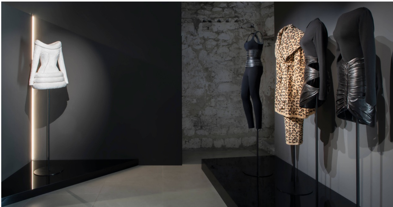
Une partie de l'exposition 'Azzedine Alaïa: L'Art de la Mode'.

L'exposition, qui a été inaugurée il y a quelques jours seulement, est installée au SCAD Fash Lacoste, rue Saint Trophime, jusqu'au 29 octobre prochain. Elle est ouverte à tout public et est accessible gratuitement du lundi au samedi de 10h à 19h.