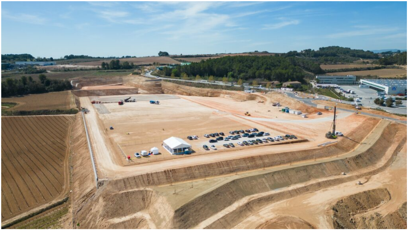
Site du futur ensemble logistique pour GLP à Barcelone