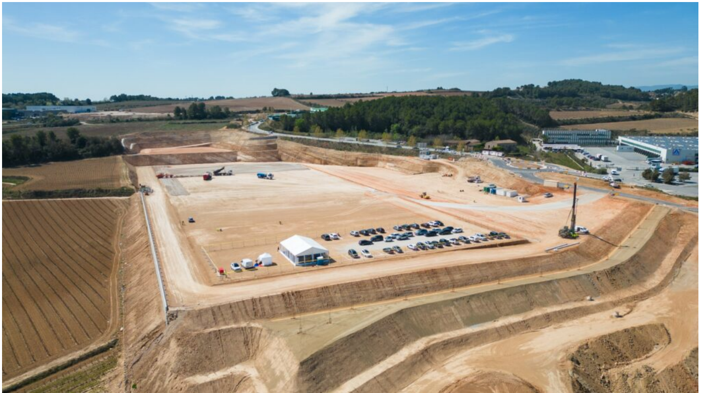
Site du futur ensemble logistique pour GLP à Barcelone