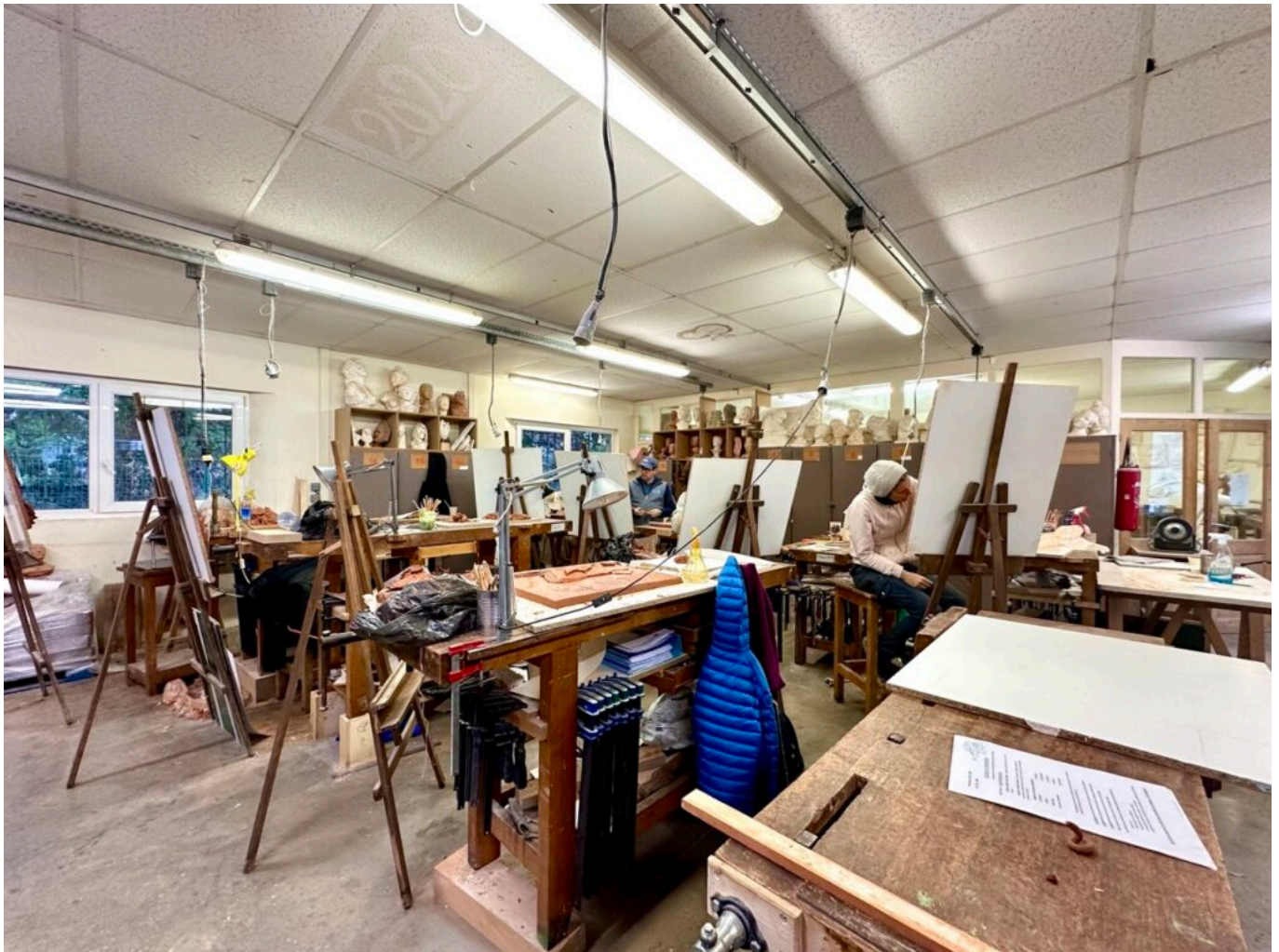
L'atelier de sculpture et dorure.