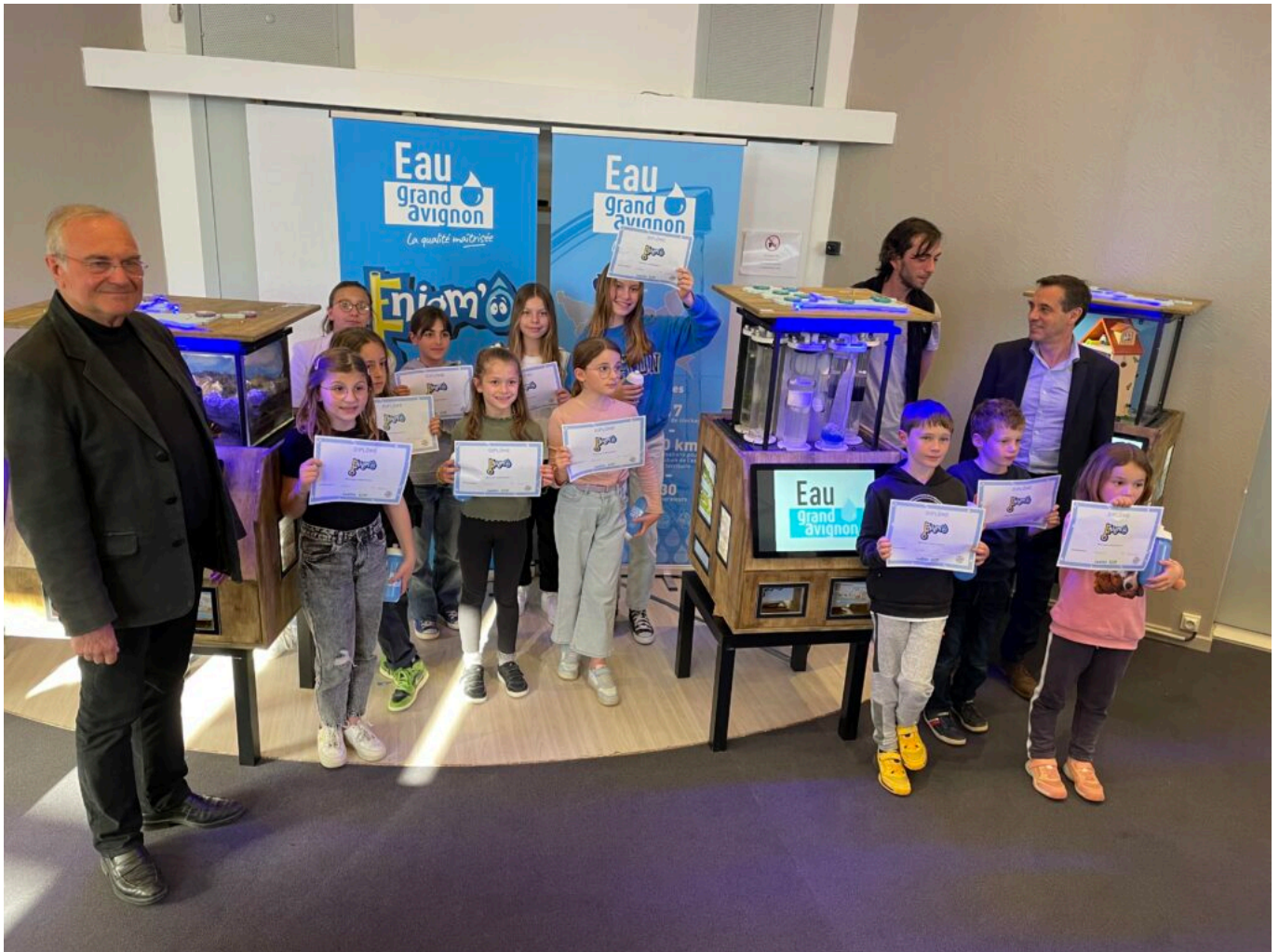
Les enfants ont reçu un diplôme ainsi qu'une gourde logotée Grand Avignon

Avec une trentaine de collaborateurs, Eau Grand Avignon -opéré par Suez- assure la gestion du service public de l'eau potable sur Avignon depuis le 1er janvier 2019, et depuis 2021, sur 7 autres communes du territoire : Morières-lès-Avignon, Jonquerettes, Villeneuve lez Avignon, Les Angles, Pujaut, Sauveterre et Roquemaure.