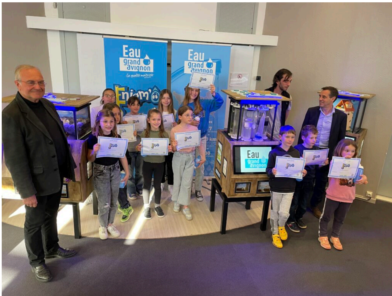
Les enfants ont reçu un diplôme ainsi qu'une gourde logotée Grand Avignon

Avec une trentaine de collaborateurs, Eau Grand Avignon –opéré par Suez- assure la gestion du service public de l'eau potable sur Avignon depuis le 1er janvier 2019, et depuis 2021, sur 7 autres communes du territoire : Morières-lès-Avignon, Jonquerettes, Villeneuve lez Avignon, Les Angles, Pujaut, Sauveterre et Roquemaure.