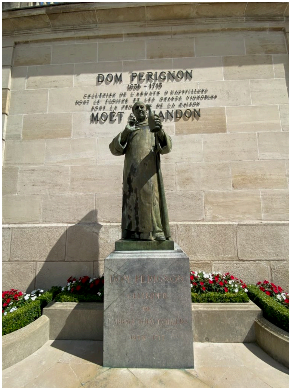
La statue de Dom Pérignon, considéré comme l'inventeur de la vinification des vins effervescents.