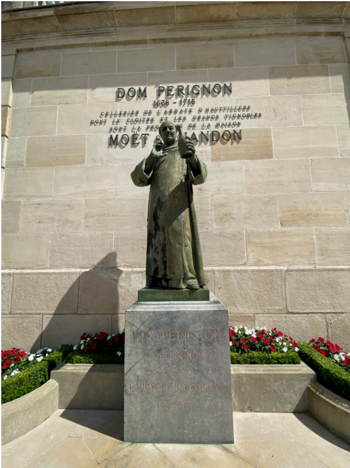
La statue de Dom Pérignon, considéré comme l'inventeur de la vinification des vins effervescents.