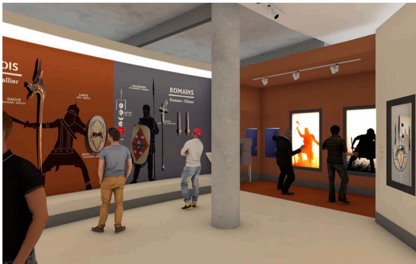
soldatskinect