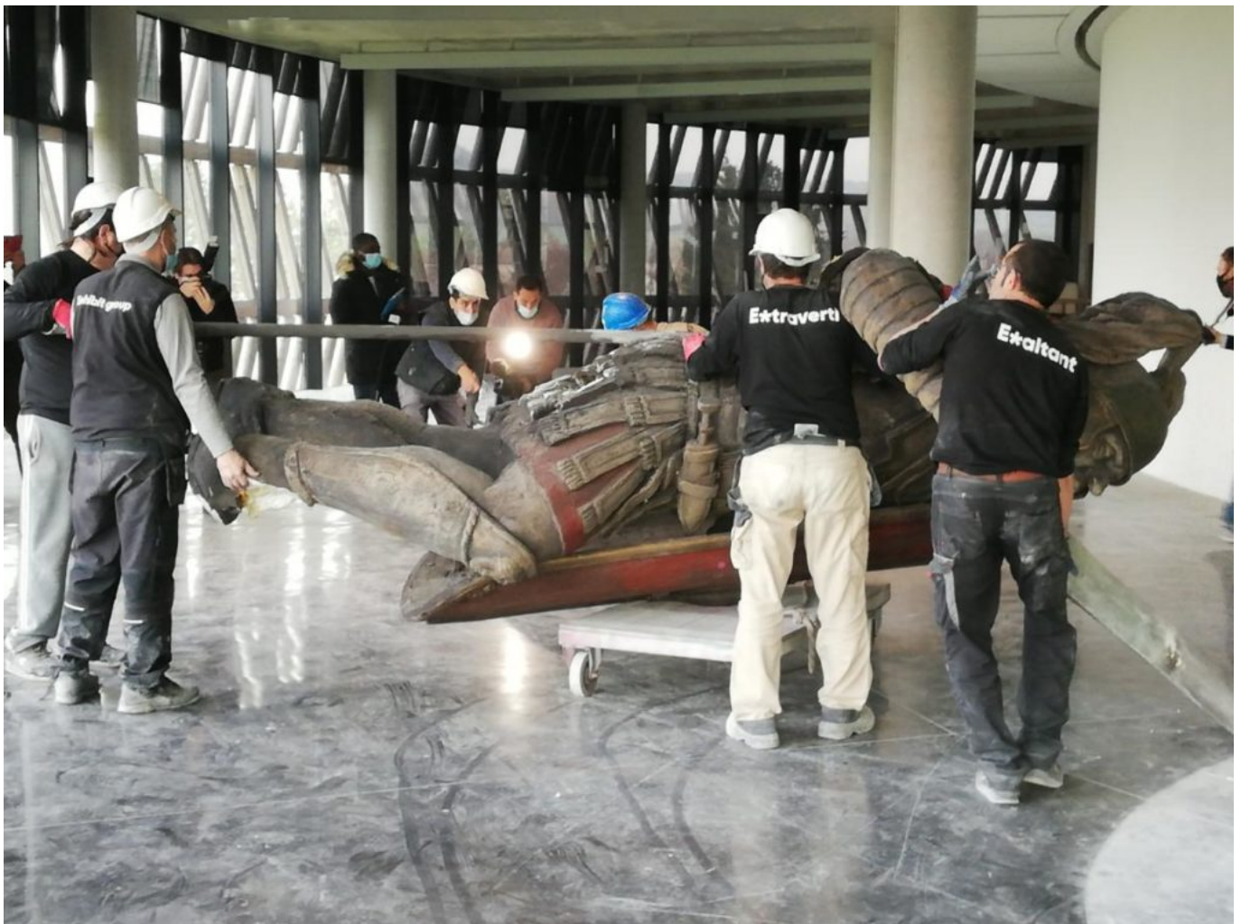
Démontage Galerie Combats.

scénographie et la direction artistique, et à sa société de production Muséomaniac pour la partie audiovisuelle et multimédia. Une frise du temps interactive accompagne ainsi la déambulation. Ponctuant cette dernière, des niches abritent des bustes en réalité augmentée de César, de Vercingétorix et de Napoléon III (le premier à entreprendre des fouilles sur le site) qui commentent, chacun à leur manière, l'histoire d'Alésia. Le visiteur peut regarder mais aussi toucher : objets sonores, bac à fouille numérique, mur magique et autres manipulations virtuelles d'armes gauloises ou romaines pour se défouler dans des combats grandeur nature.