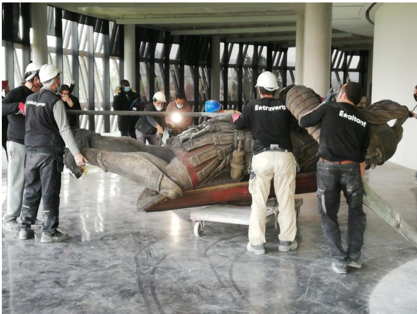
Démontage Galerie Combats.

scénographie et la direction artistique, et à sa société de production Muséomaniac pour la partie audiovisuelle et multimédia. Une frise du temps interactive accompagne ainsi la déambulation. Ponctuant cette dernière, des niches abritent des bustes en réalité augmentée de César, de Vercingétorix et de Napoléon III (le premier à entreprendre des fouilles sur le site) qui commentent, chacun à leur manière, l'histoire d'Alésia. Le visiteur peut regarder mais aussi toucher : objets sonores, bac à fouille numérique, mur magique et autres manipulations virtuelles d'armes gauloises ou romaines pour se défouler dans des combats grandeur nature.