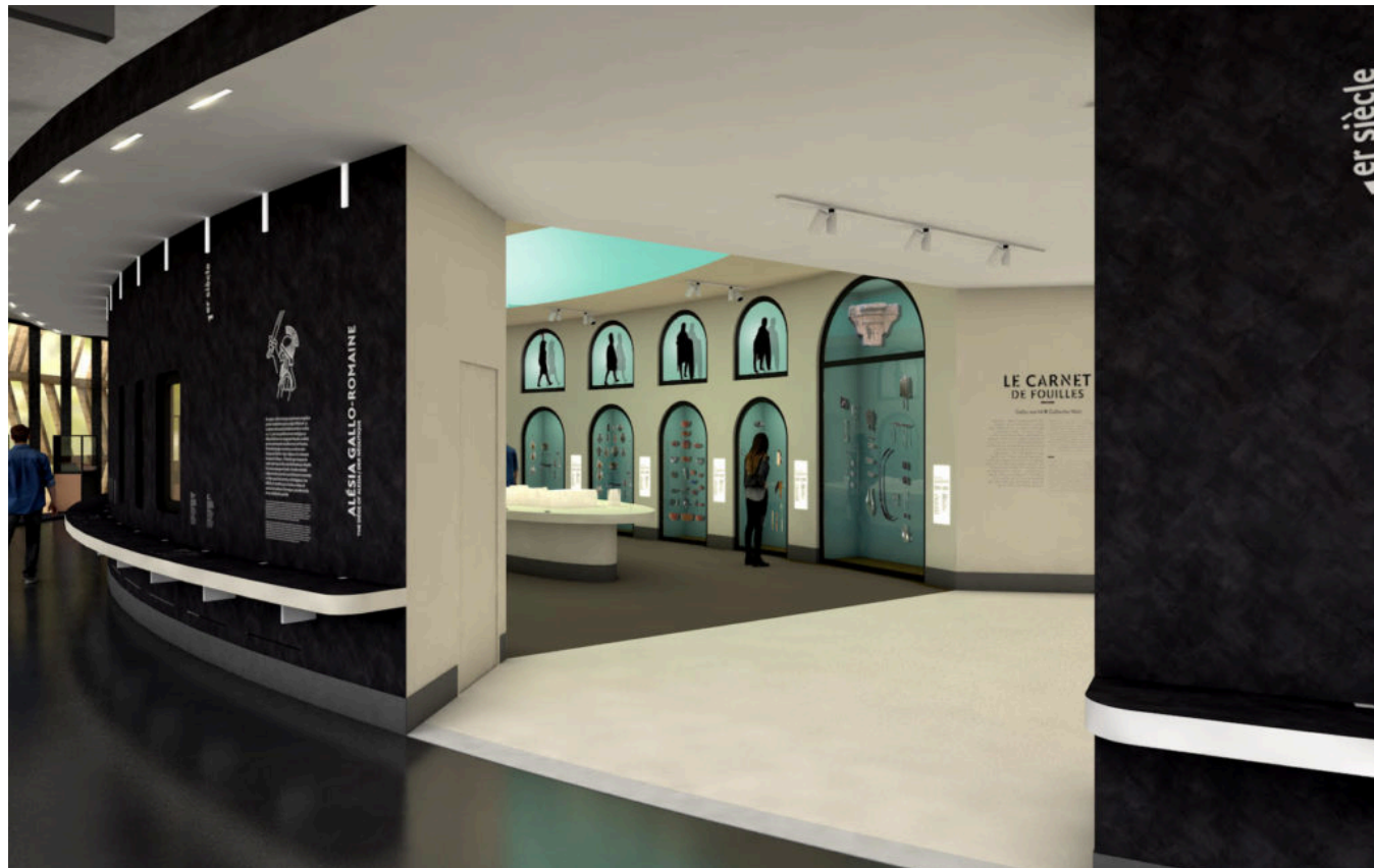
Couloir du temps-gallo romain-Agence Clemence Farrell

Par Frédéric Chevalier, pour Réso Hebdo Éco.