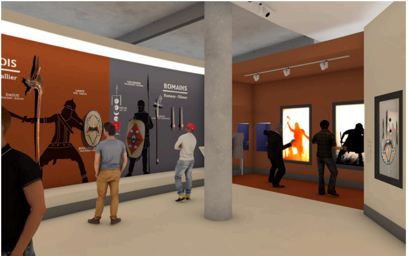
soldatskinect