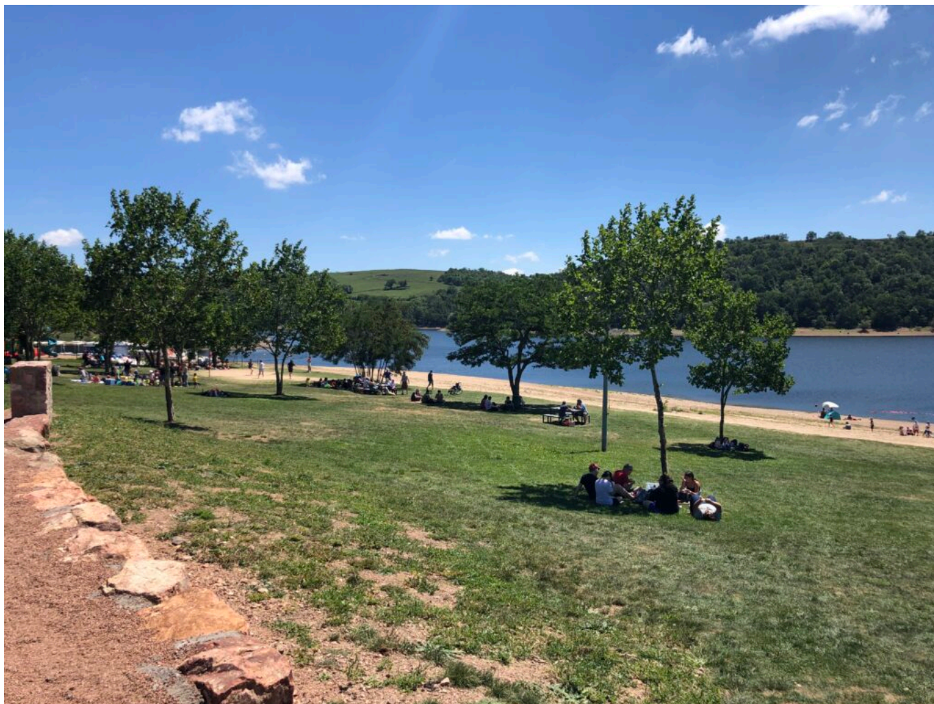
Le lac de Villerest