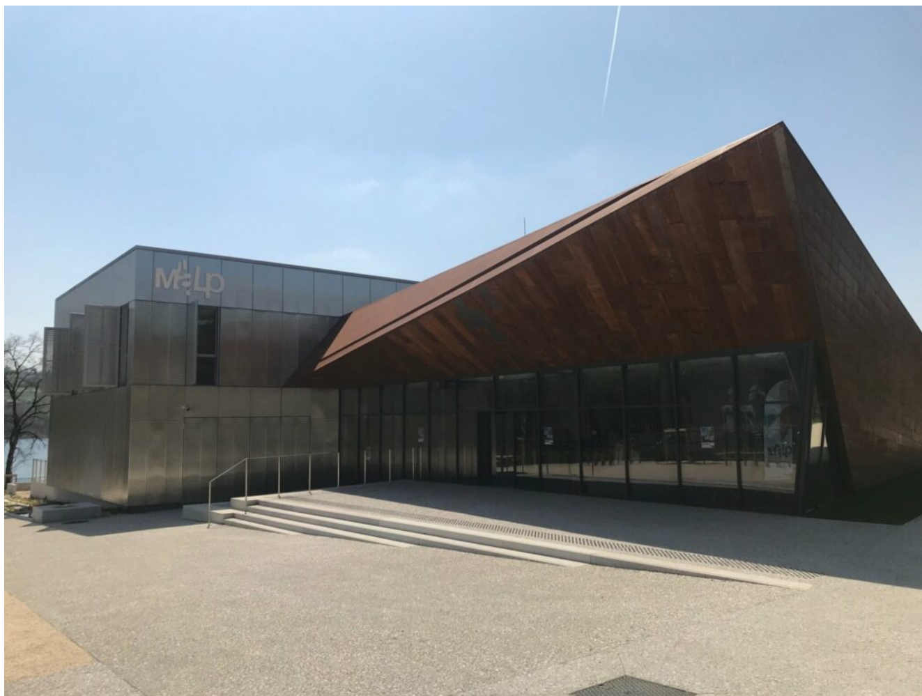
Le Malp

les rares de France d'origine glaciaire, il réserve encore bien des secrets dans ses fonds. Le lac est en effet un haut lieu de l'archéologie française. Si deux périodes de fouilles ont déjà donné lieu à de grandes découvertes il est certain que les fonds du « Lac bleu » - comme l'appellent les habitués - regorgent encore de vestiges vieux de plus de 1 000 ans. A ce propos, on peut profiter de la baignade pour visiter le Musée archéologique du lac de Paladru (MALP) qui a ouvert ses portes le 7 juin dernier. Sur un grand plateau, il expose les objets découverts lors de deux importantes périodes de fouilles du lac, en retraçant les vies des habitants du bord du lac au Néolithique et en l'an Mil. Parmi les pièces à découvrir : une majestueuse barque en bois flotté, symbole du Malp puisque le bâtiment représente cette embarcation renversée. Mais aussi des armes d'époque : arc, haches et pointes de flèches. Des poteries, mais aussi des jeux de société, des vêtements... On y découvre aussi les raisons qui ont poussé les habitants à s'en aller. A l'époque déjà, une montée des eaux, due au réchauffement climatique.