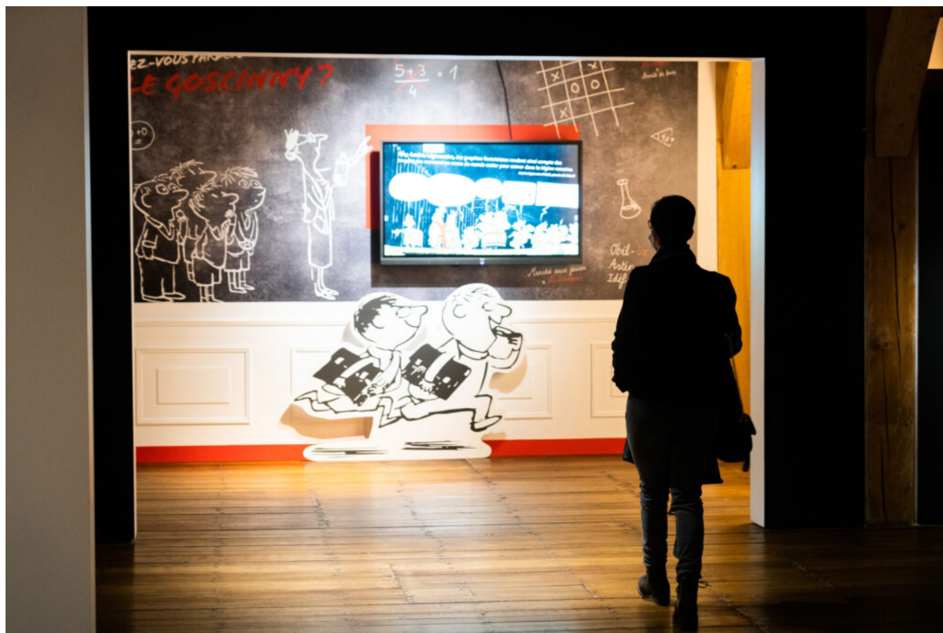
L'Exposition Goscinny au Château de Malbrouck.