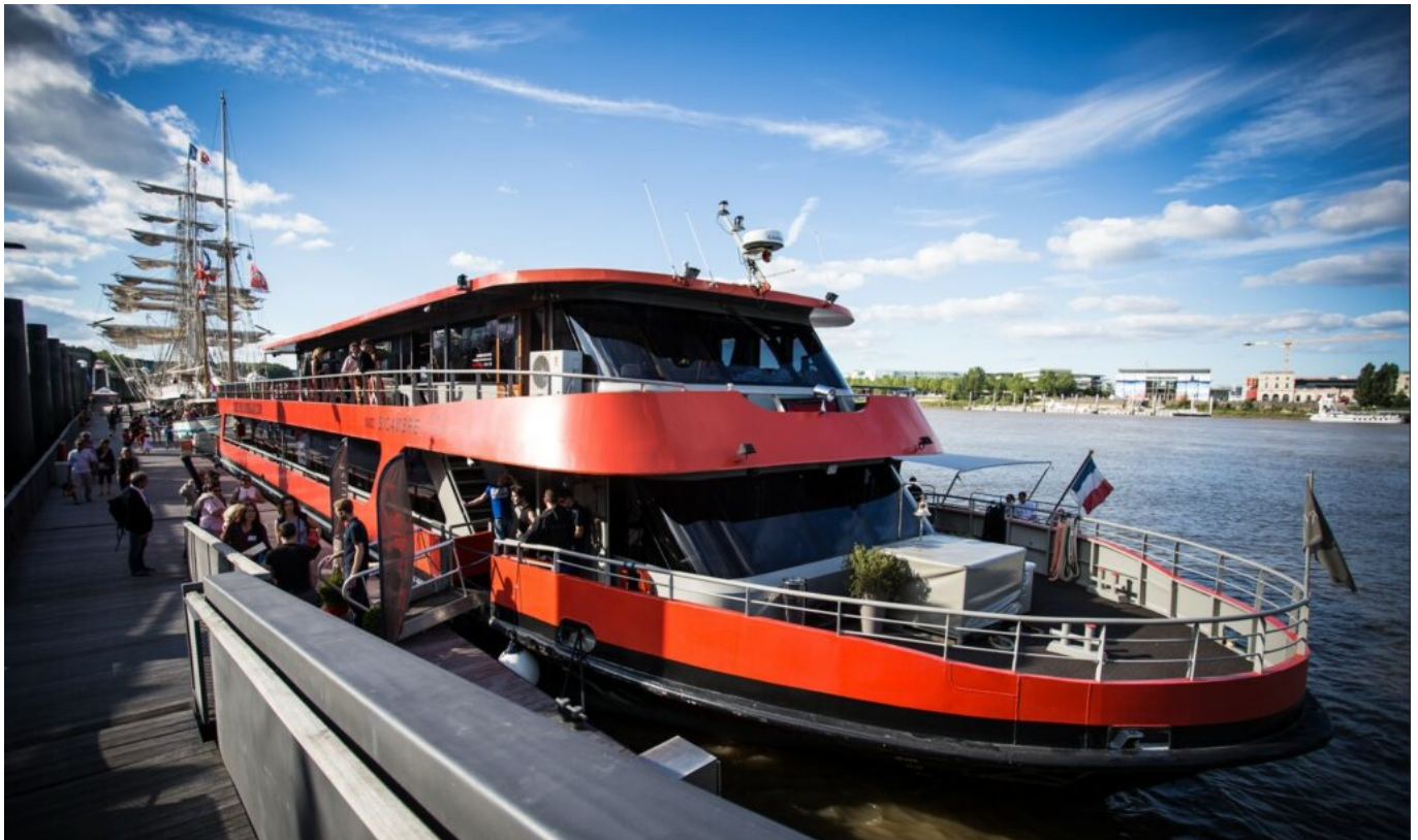
Le Sicambre à Bordeaux