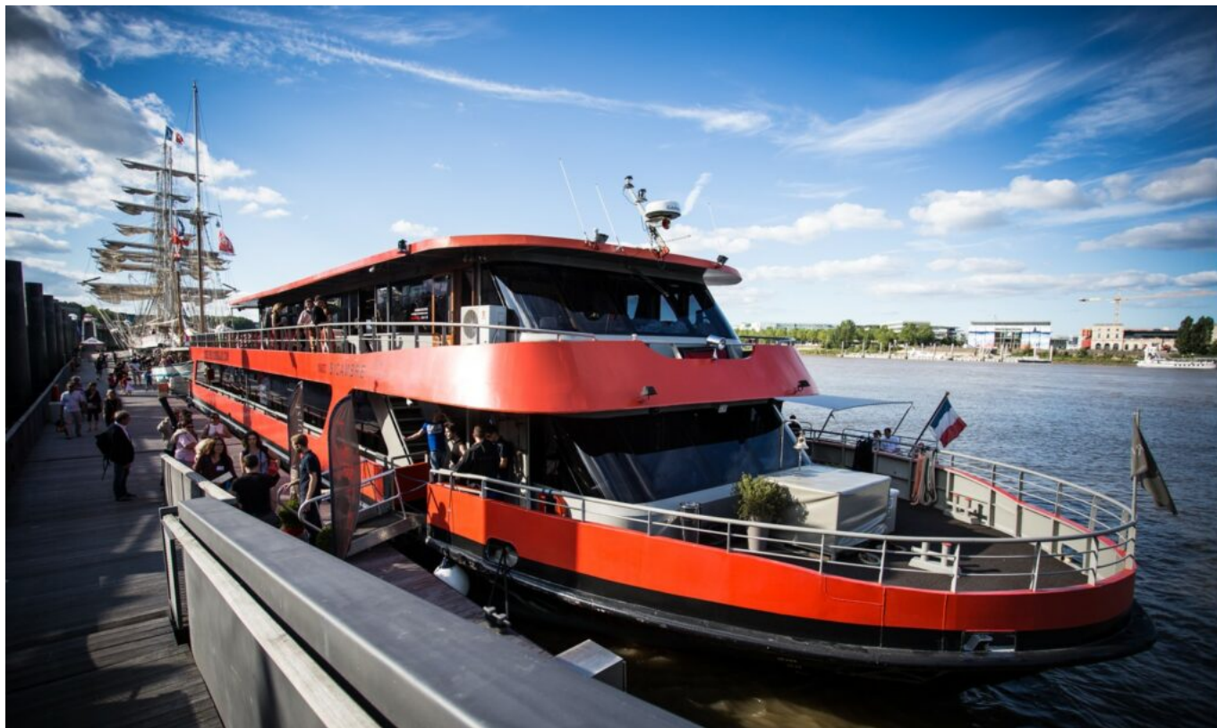
Le Sicambre à Bordeaux