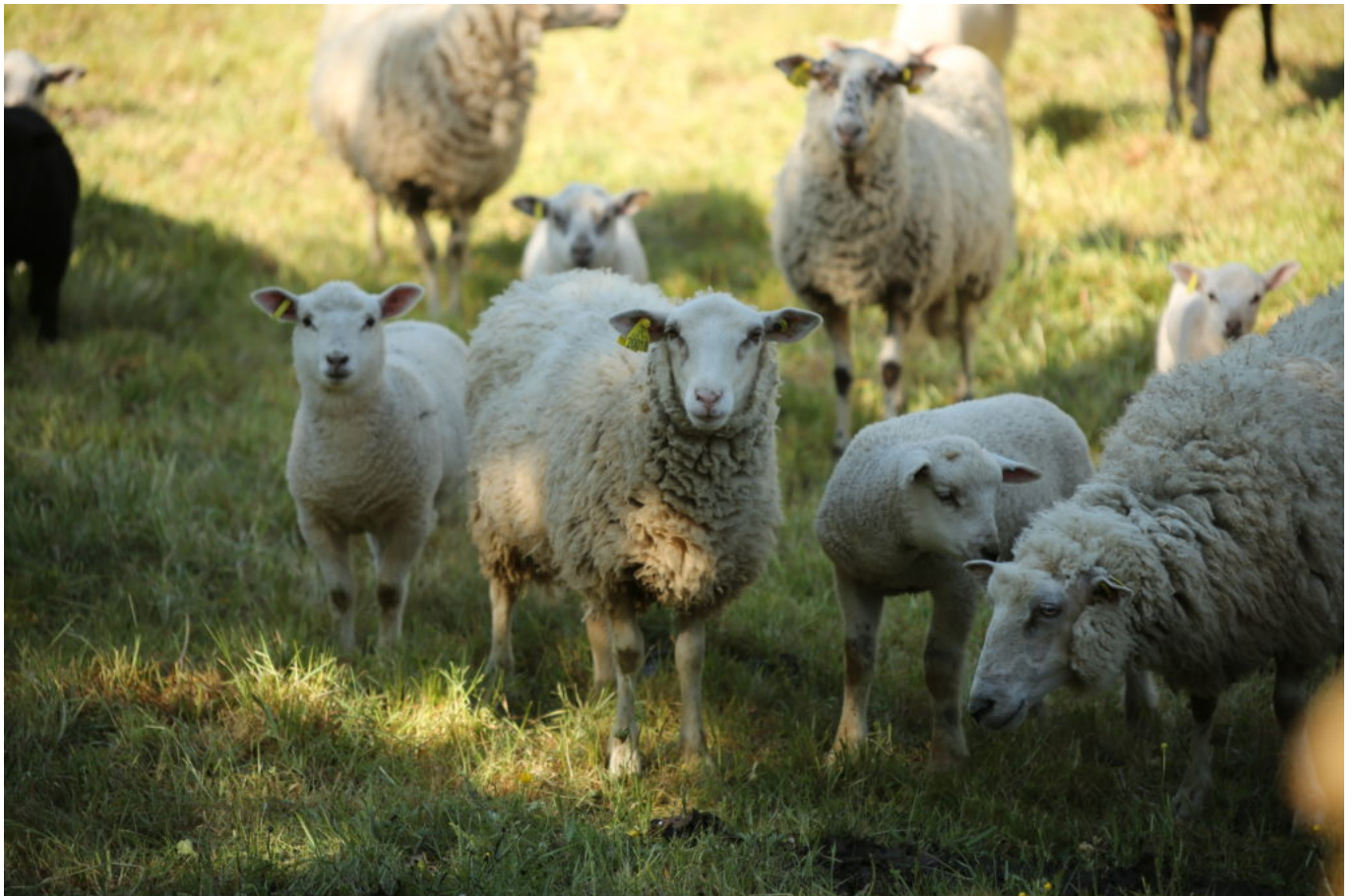
Le Mouton de Belle-Île, Association Dened ar Vro, Moutons des Pays de Bretagne, Pays de la Loire, 3e prix 2021.