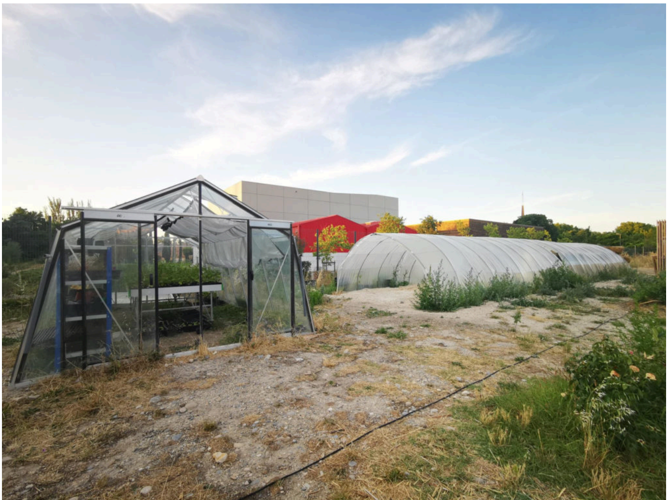
15 arbres fruitiers, des serres et beaucoup d'amour.

57 Avenue Eisenhower, Avignon, http://www.lesitedutipi.fr/ ; 06 26 76 75 00.