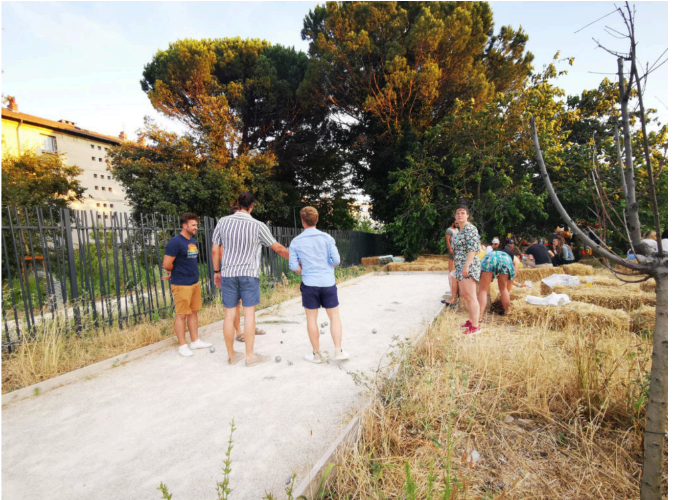
Une petite partie de pétanque ?