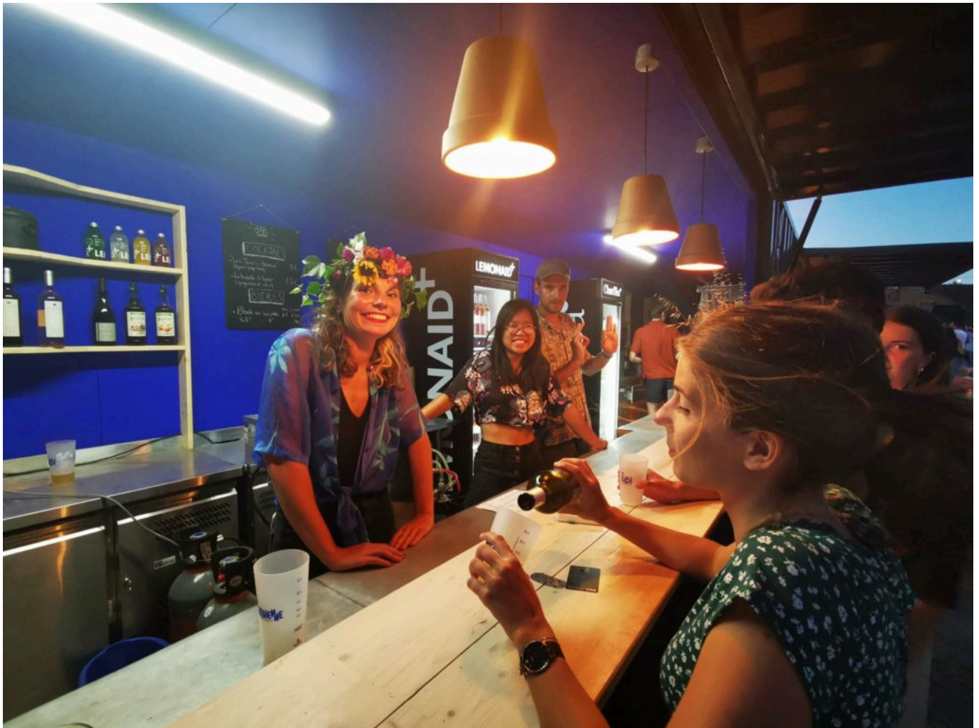
On vous met au défi de ne pas craquer au bar.

« On sert comme bureau d'étude aux collectivités pour l'accompagnement à la transition écologique. On souhaiterait à terme créer un deuxième lieu de ce genre », ambitionne Paul-Arthur. Le Grand Avignon, la Ville d'Avignon, l'Etat, les bailleurs sociaux se sont engagés depuis 2018 dans un ambitieux programme de renouvellement urbain, baptisé « L'ambition urbaine », qui vise à métamorphoser les 3 quartiers prioritaires de la commune d'Avignon. Les objectifs : améliorer durablement le cadre de vie quotidien des 25 000 habitants qui vivent dans les quartiers Sud, Saint-Chamand et nord-est d'Avignon, favoriser la mixité, le développement économique et renouveler l'image de ces quartiers. Une enveloppe de 311 000€ est alors débloquée.