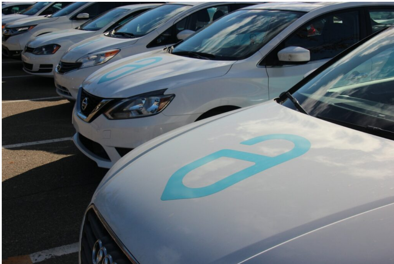
Véhicules floqués avec le logo de l'entreprise.