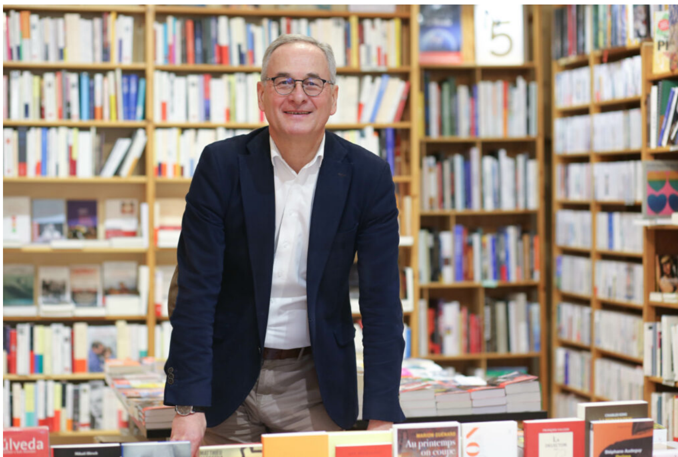
Humbert Mogenet