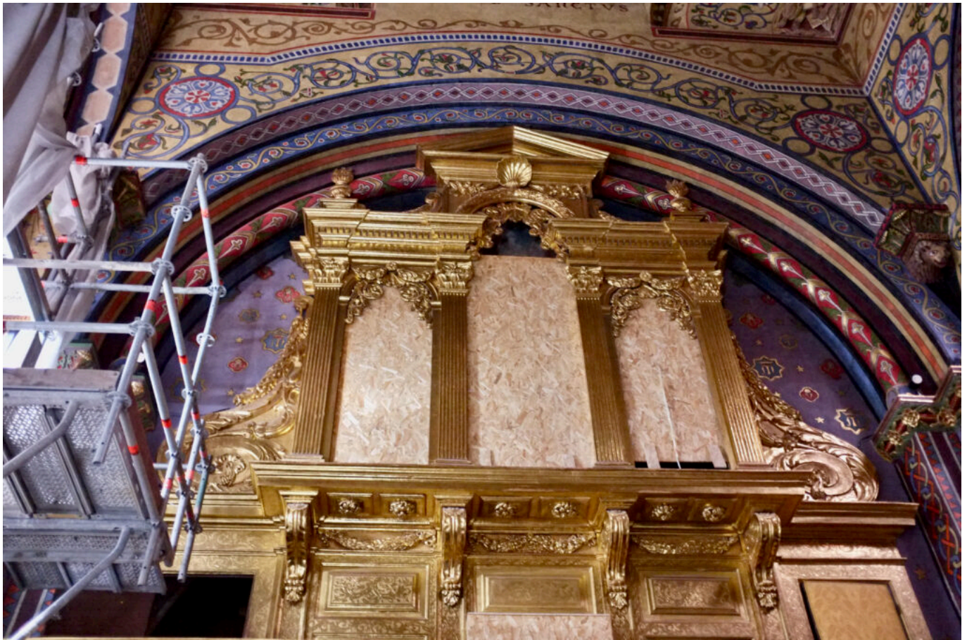
le cœur ©DB