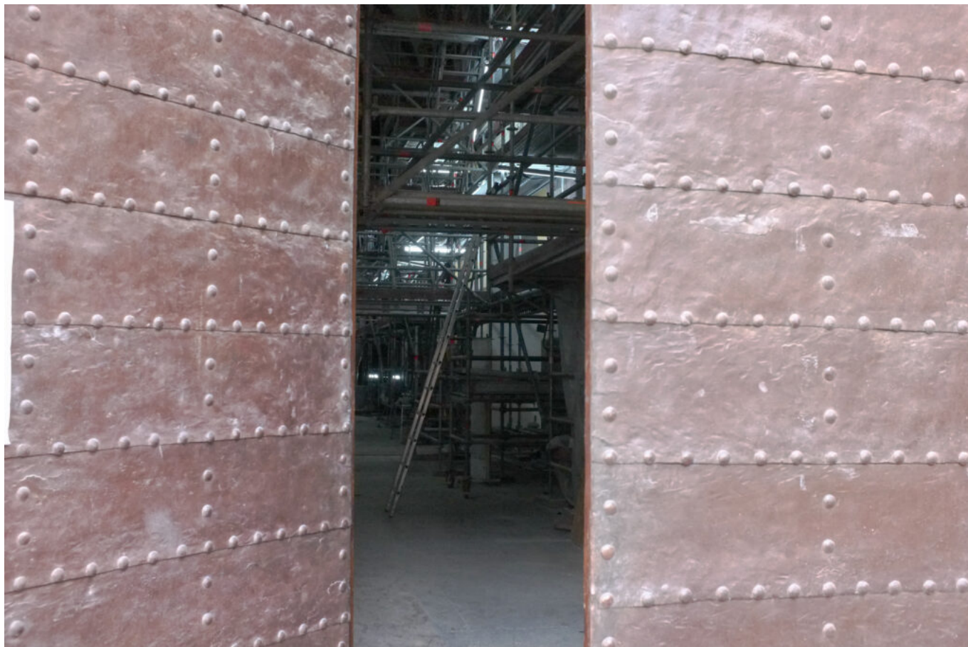
la porte d'entrée ©DB