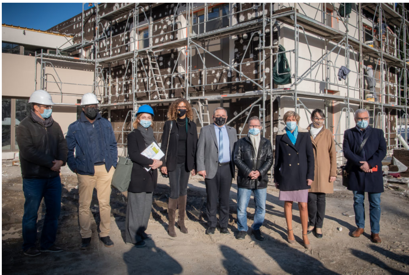
Visite de chantier.