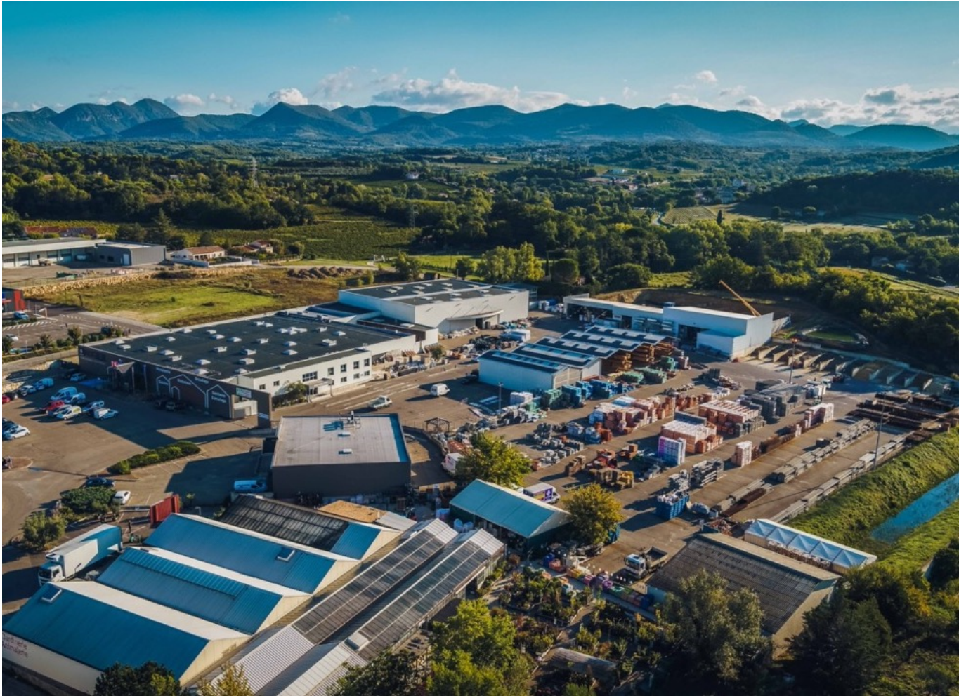
Le site Augier, à Vaison-la-Romaine.