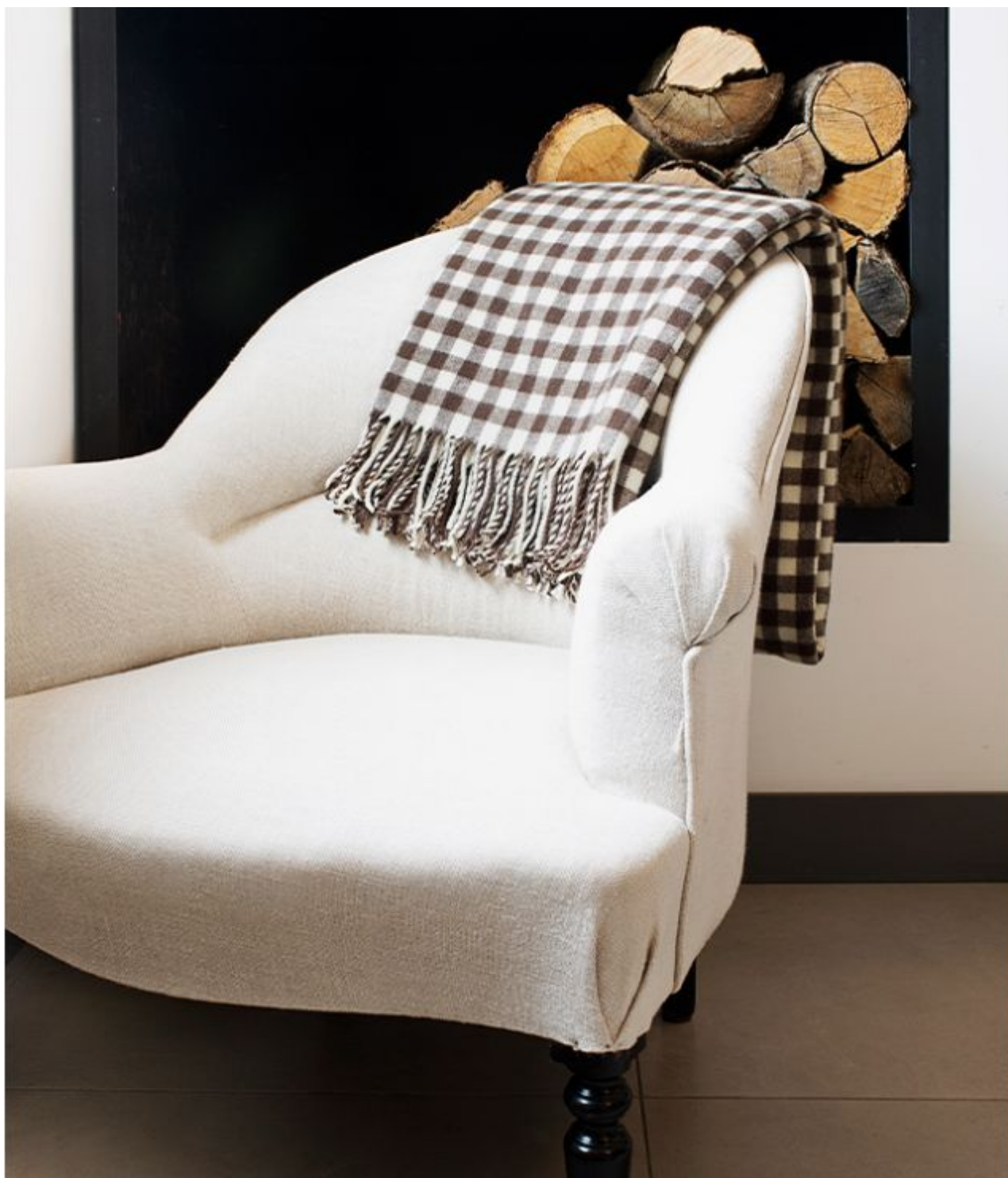
La nouvelle collection 'Arles, entre Camargue et Alpilles'.