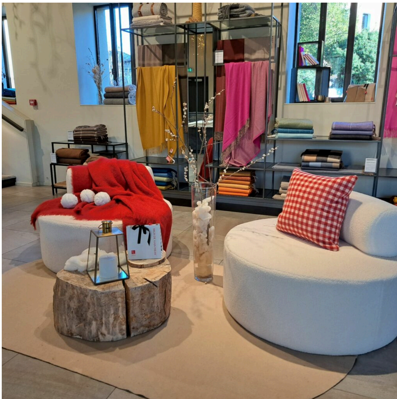
La boutique de Brun de Vian-Tiran.