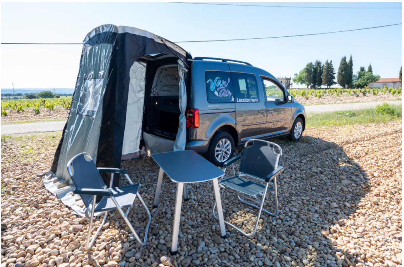
Le Caddy Beach avec une tente de hayon.