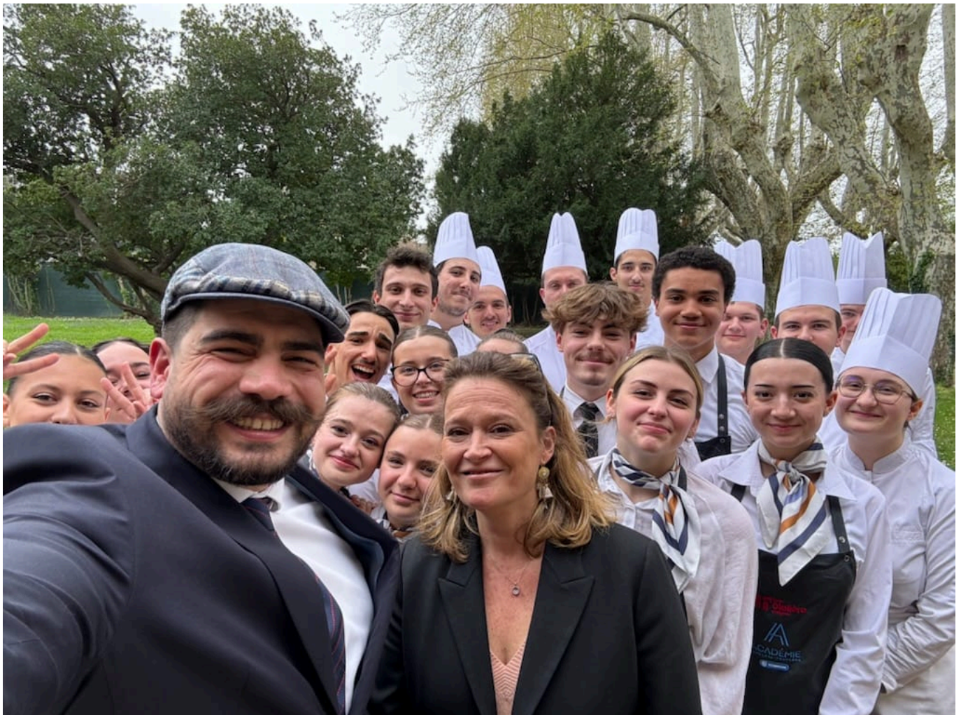
Les deux ministres aux côtés des apprentis de l'école hôtelière d'Avignon.