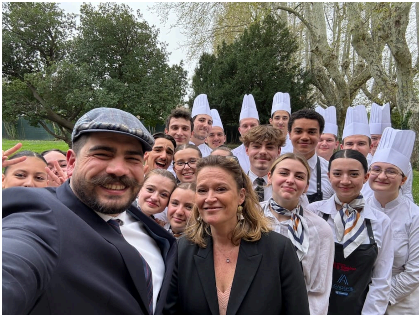
Les deux ministres aux côtés des apprentis de l'école hôtelière d'Avignon.

La transformation des zones commerciales qui passe avant tout par le commerce, passera également par le service public et par le logement car ce volet devrait permettre de créer plus d'offres sur les territoires qui en ont besoin en ces temps où la pression foncière se fait de plus en plus forte « la transformation de nos zones commerciales passe bien évidemment par le logement. On a souhaité repenser notre modèle face à l'étalement urbain et aujourd'hui le logement est porteur de dynamique économique et vient répondre à une crise du logement où les français ont des difficultés à trouver des logements de qualité à prix abordables donc ce projet est une grande opportunité pour l'avenir » conclut Guillaume Kasparian.