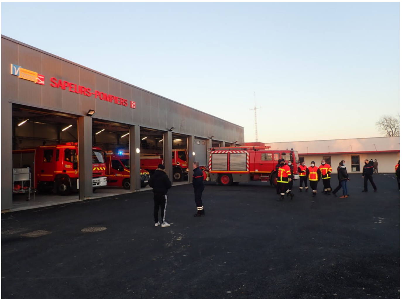
La nouvelle caserne des pompiers se situe à Entraigues.

Après une photo souvenir en présence des élus de la commune, les pompiers ont défilé dans le village au son des sirènes pour un au revoir retentissant. Ils ont ensuite rejoint leurs homologues Entraiguois à la nouvelle caserne où chacun a pu prendre ses quartiers. « Bien que nos pompiers soient désormais basés à quelques kilomètres du centre-ville d'Althen, cela ne changera en rien leur engagement aux services de la population », conclue la municipalité d'Althen-des-Paluds.