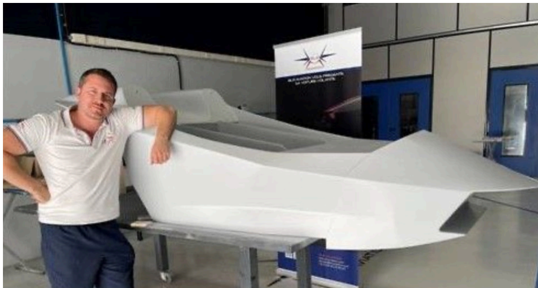
Le moule du châssis.