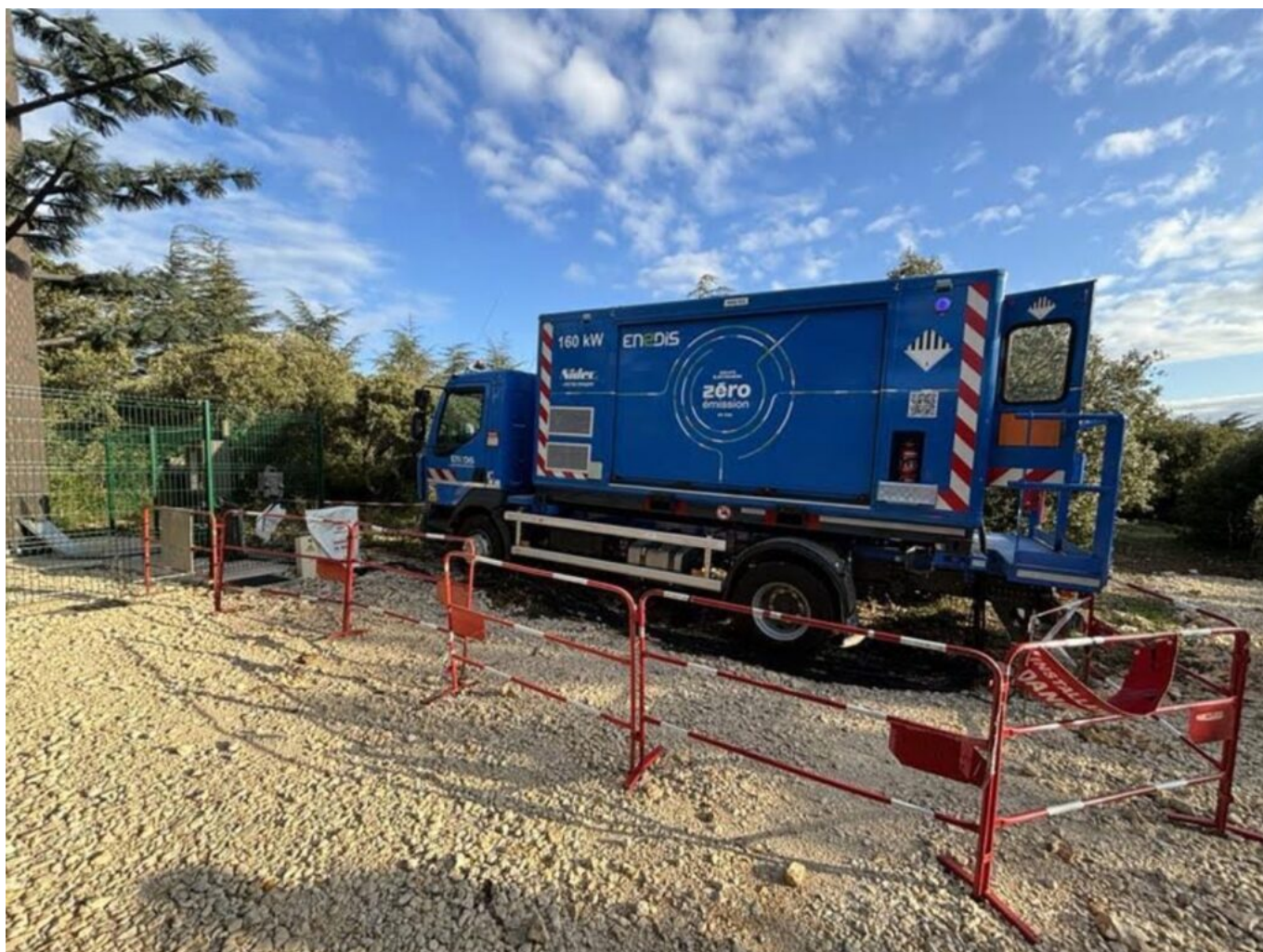
Le groupe électrogène zéro émission.

Le diagnostic des lignes est réalisé par les équipes d'Enedis à l'aide d'une intelligence artificielle qui établit le diagnostic final à partir d'un traitement de données et qui évalue l'ensemble de matériel nécessaire à la remise en état complète des portées aériennes. Pour le bon déroulement des travaux et éviter des coupures d'électricité trop longues, neuf groupes électrogènes ont été installés, dont un zéro émission qui ne produit ni d'émissions de CO2 ni de pollution sonore.