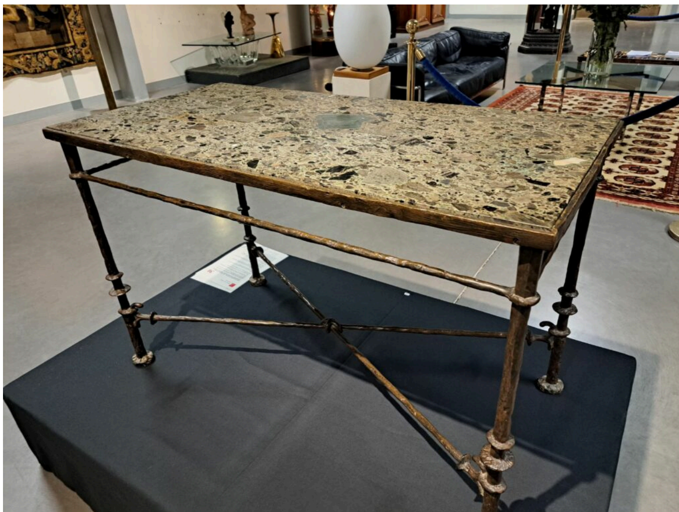
La console de Diego Giacometti a grimpé à 676 000€