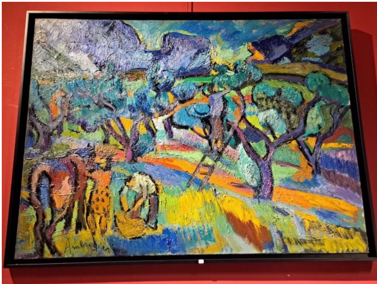
Œuvre de Pierre Ambrogiani