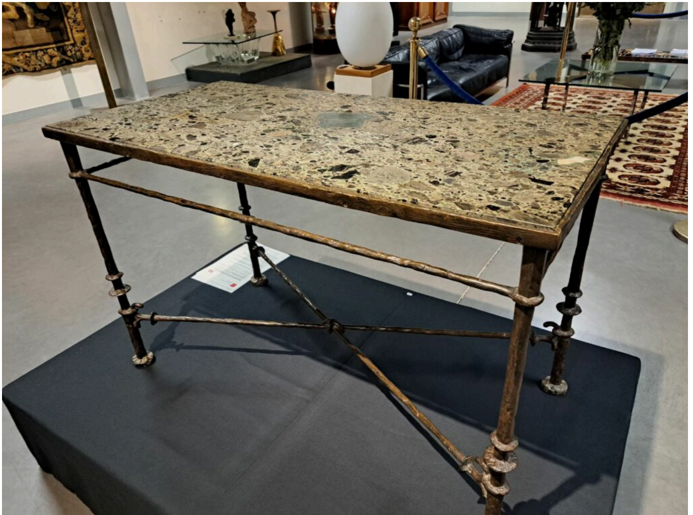
La console de Diego Giacometti a grimpé à 676 000€