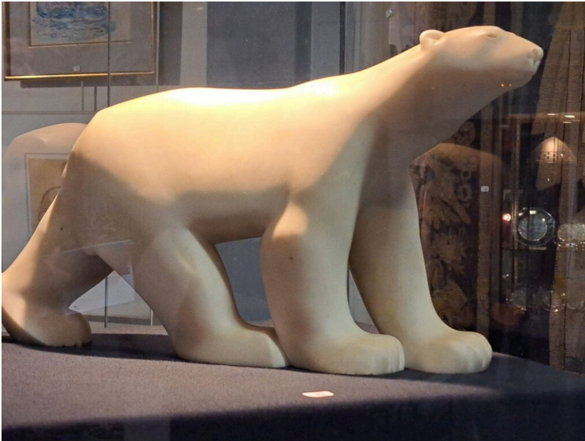
Ours Blanc de François Pompon