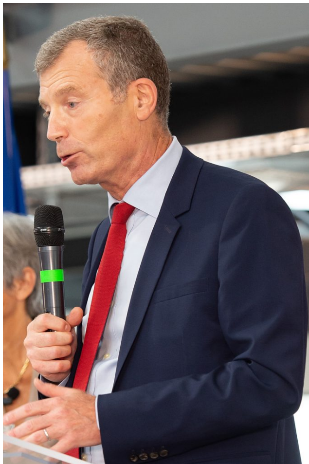
Christophe Mirmand, préfet de Région.