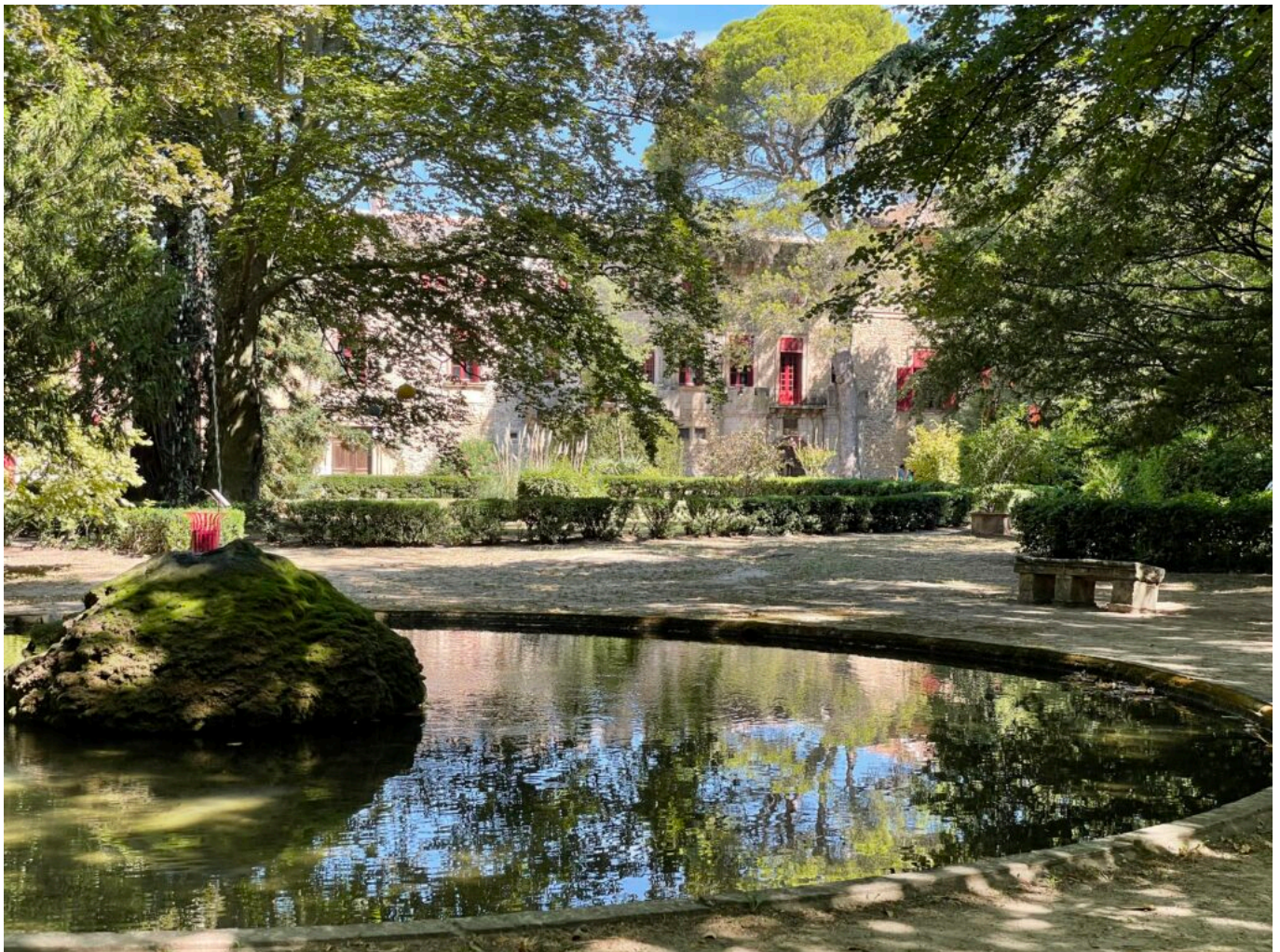
Vue du parc vers le Château

au cœur de l'histoire et de la beauté. Participez à cette renaissance et découvrez les mystères que recèle ce monument exceptionnel. Ensemble, faisons briller à nouveau le 'Diamant de Provence'.