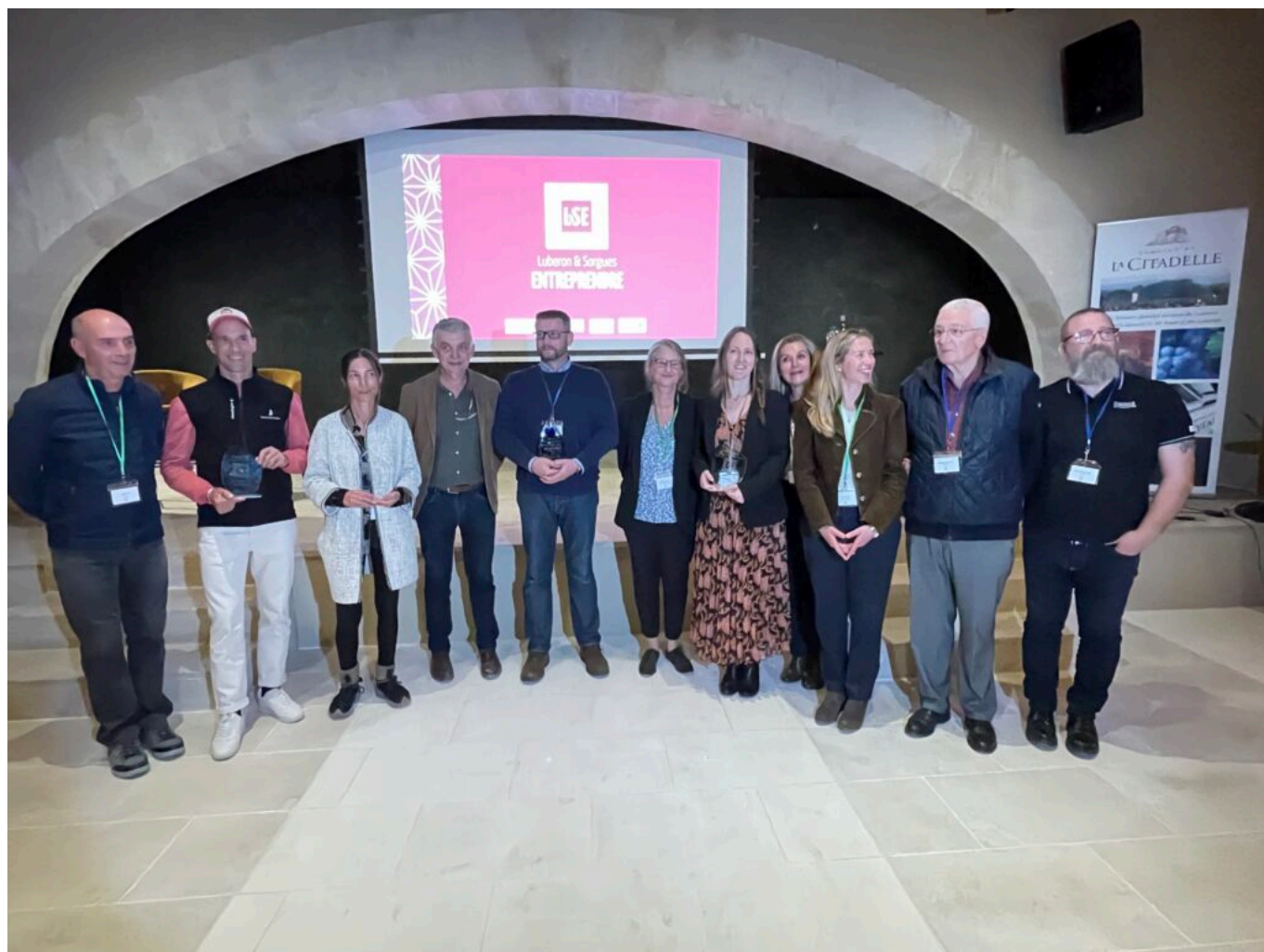
Les lauréats et partenaires

Le jury était composé de la CCPSMV , Communauté de communes Pays des Sorgues et Monts de Vaucluse ; de la CALMV , Communauté d'Agglomération Luberon Monts de Vaucluse ; de la CMAR (Chambre des métiers et de l'artisanat de Provence-Alpes-Côte d'Azur) ; du Réseau Entreprendre ; d' Initiative Terre de Vaucluse ; du Lycée Alphonse Benoît ; du Greta (Groupement d'établissements publics locaux d'enseignements), d'anciens lauréats et d'une journaliste.