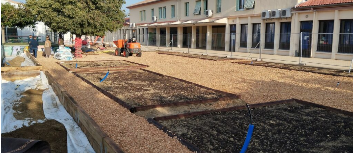
Le chantier de désimperméabilisation de l'école.

Louis Driey est intarissable sur les chantiers qu'il a initiés pour améliorer la qualité de vie de ses concitoyens tout en minimisant les factures. « L'éclairage public se fait avec des LED, ça représente quand même 1 200 lampadaires. »