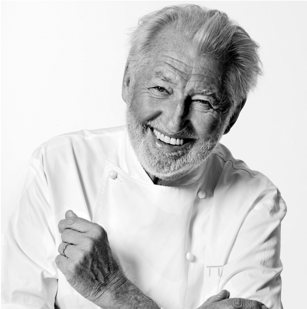
Pierre Gagnaire

Pour la 1ère fois sera installé dans la Salle des Fêtes du Parc de l'Arbousière, un « Salon des Vins et des Spiritueux » avec les représentants de 25 caves et 5 distilleries, dont le local du lieu, le Caveau Colombes-des-Vignes de Châteauneuf-de-Gadagne, le Château Mongin d'Orange, le Domaine de la Royère d'Oppède, celui de Xavier Vignon de Beaumes-de-Venise et la Distillerie « Spiritum » de Saint-Didier ou « Fari » de Vaison-la-Romaine. Des photos magnifiques du vigneron Guenhael Kessler (exposé par ailleurs à la nouvelle Maison des Vins de Tavel) de grains de raisins, de grappes, de ceps, de rangées de vignes, de mains usées de vigneronniers seront affichées. Sont prévus aussi des ateliers de dégustation et de mixologie (art de mélanger des boissons).