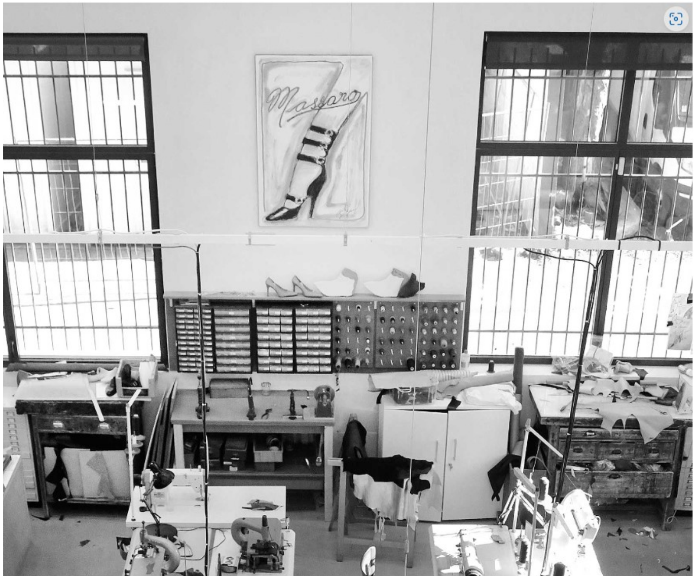
DR Les ateliers Massaro

Musée Angladon ici . Du mardi au dimanche. De 13h à 18h. Toutes les infos pratiques ici et ici . 15€. MH