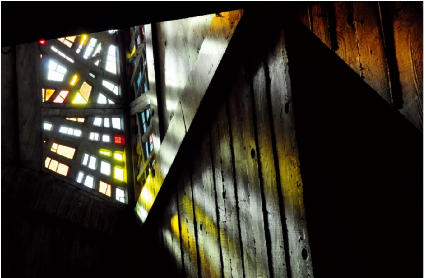
Église Saint-Joseph-Travailleurs d'Avignon.