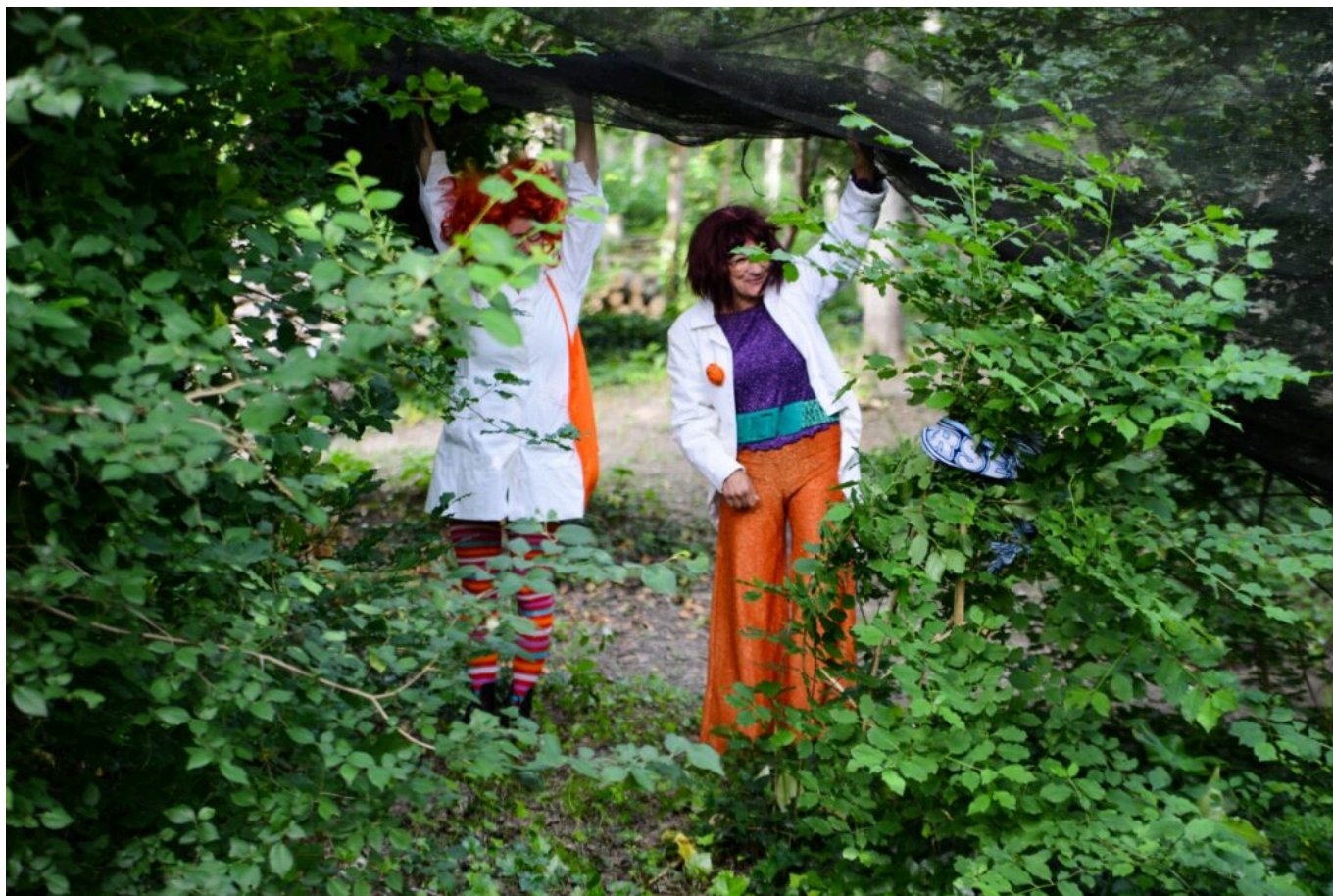
Les Fêlées du Tronc © DR