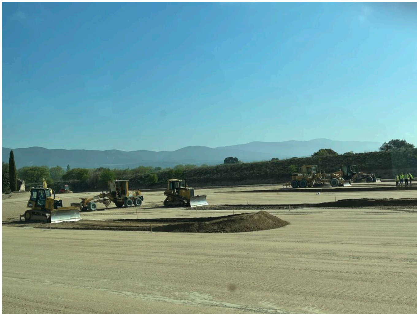
Exercices de terrassement