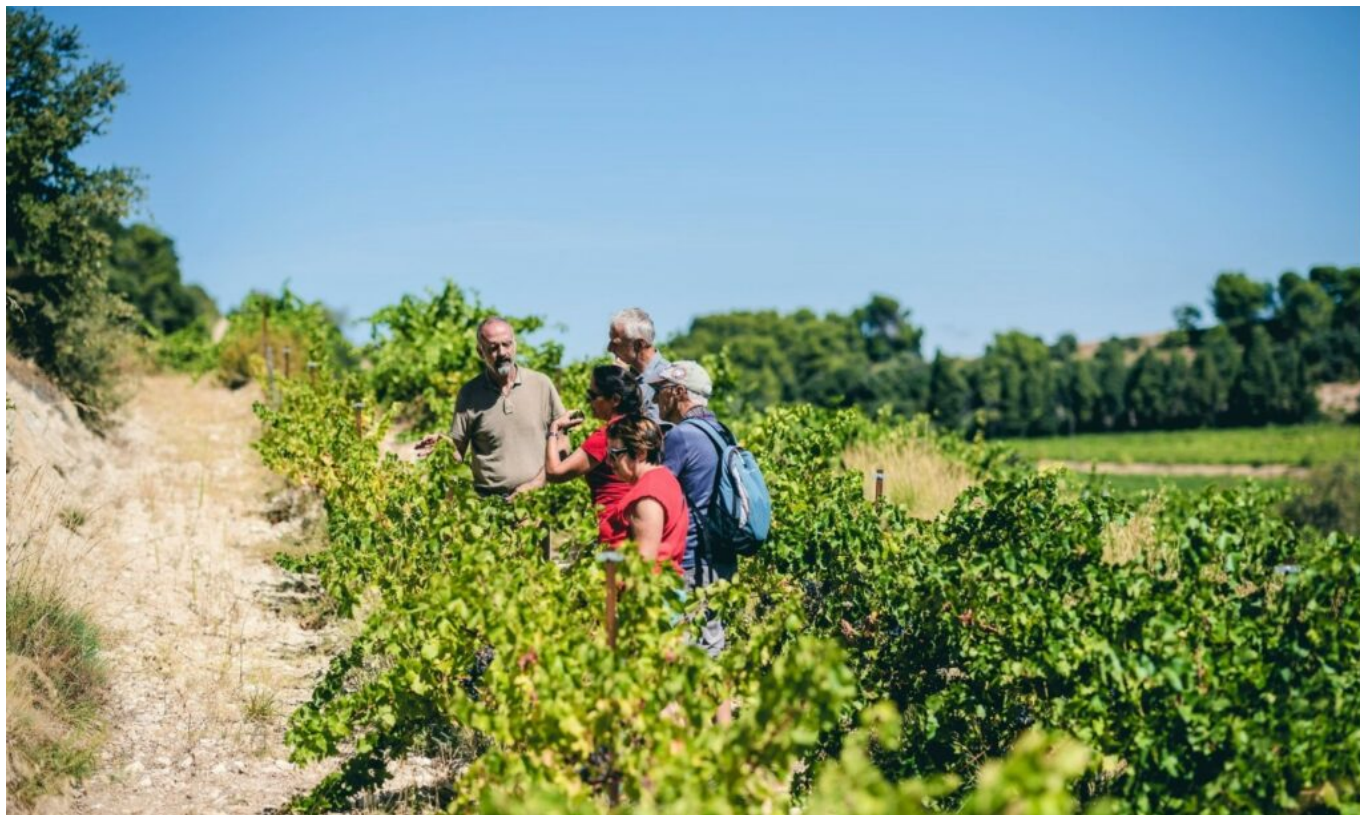
Cultures à flanc de coteaux