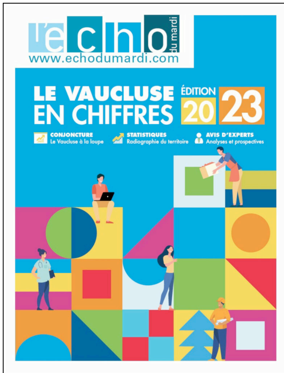
Le "Vaucluse en chiffres- Edition 2023" réalisé par L'Echo du mardi