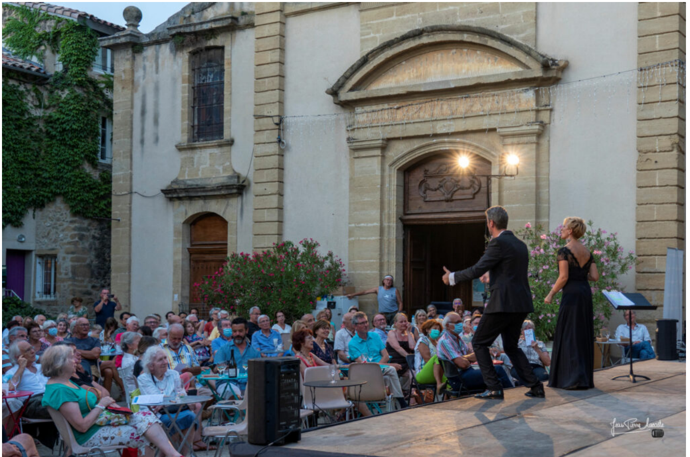
Festival Durance Luberon édition 2021