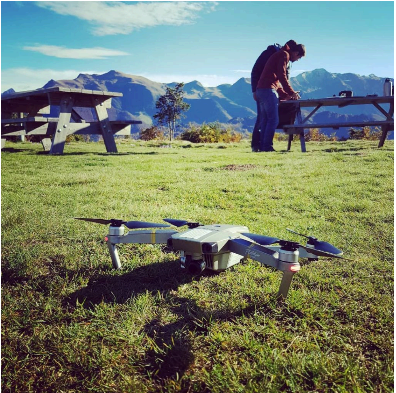
Formation Topographie et Inspection en Milieux Naturels par Drone.