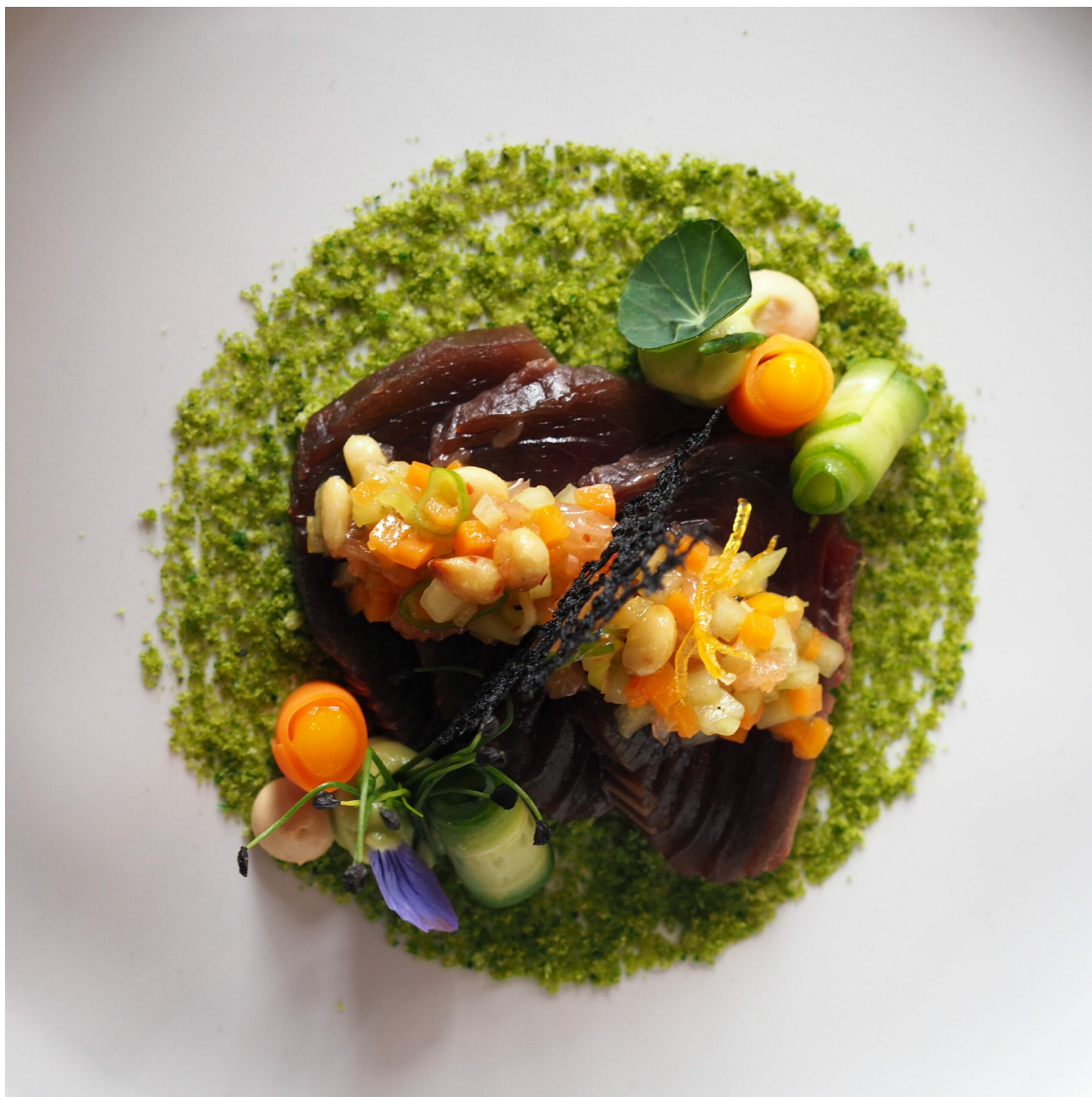
Bonite de Méditerranée travaillée de deux façons par Hevé Matthieu

réussi de saveurs et de textures. Elle était accompagnée d'un Clos du Belvédère blanc 2021 du Château de Vaudieu.