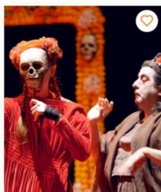
Les Bonnes ou la tragédie des confidentes

Près de 91% des professionnels accrédités sont français (soit 1 953) ; 27% d'entre eux proviennent de la région Île-de-France ; 22% de la Région Sud ; 14% de la région Auvergne-Rhône-Alpes et 10% de la région Occitanie. Et, surtout 75% de ces professionnels sont issus de structures subventionnées. De même une à 3 personnes sont employées par la même structure.