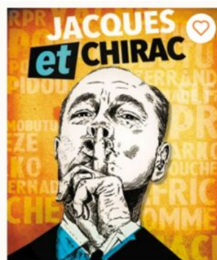
Jacques et Chirac